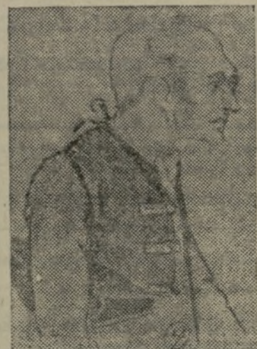
John Elwes, que durante su vida no tuvo más que un vestido que ponerse.

—Me atrevo a decirte que apenas podrás pasar con tu reducida renta, Jorge—le observó el mar-