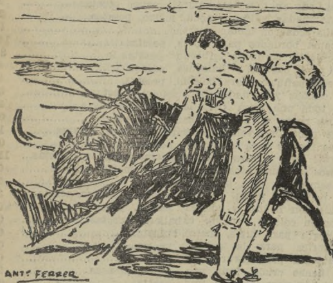
CHICUELO TOREANDO DE MULETA AL PRIMER TORO

Al final fué sacado a hombros. Con los de Chicuelo fueron los lances de capa de Torres (no todos, ¿eh?) los más toreros y artísticos de la corrida. También En-