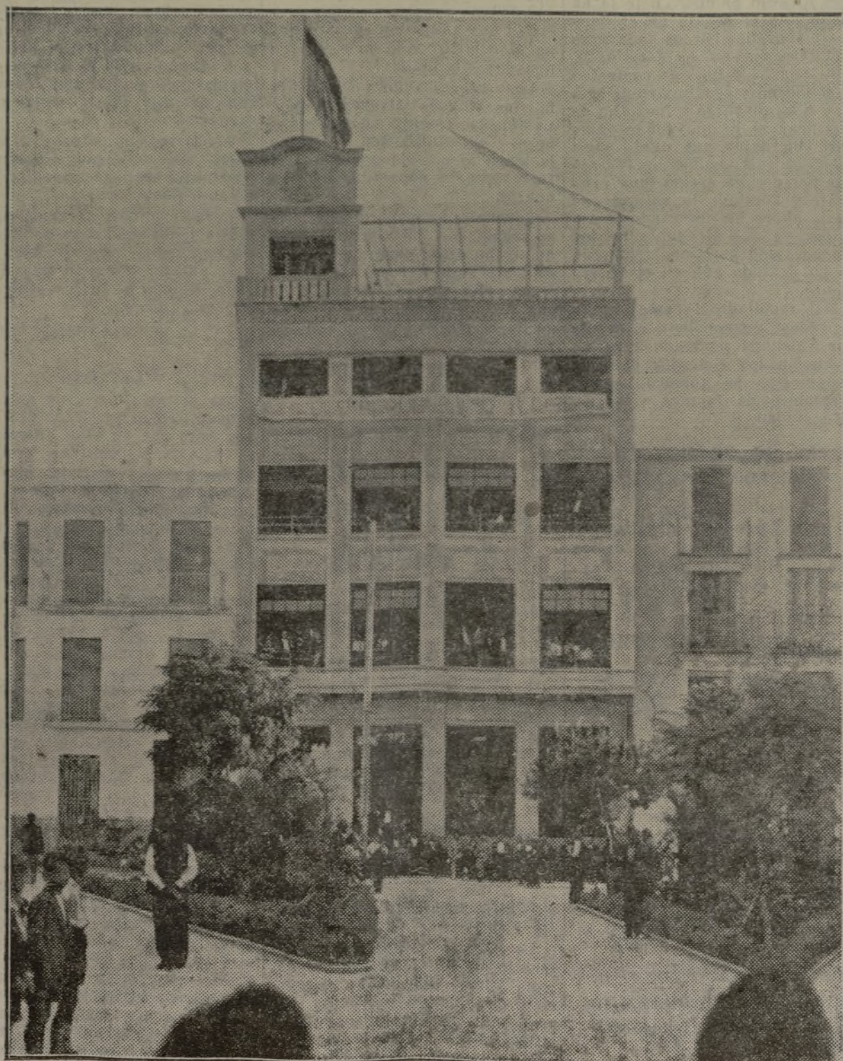
HE AQUÍ EL NUEVO EDIFICIO QUE LOS REPUBLICANOS ALCIREÑOS HAN LEVANTADO PARA HOGAR SOCIAL EN LA PLAZA DE CASTELAR.