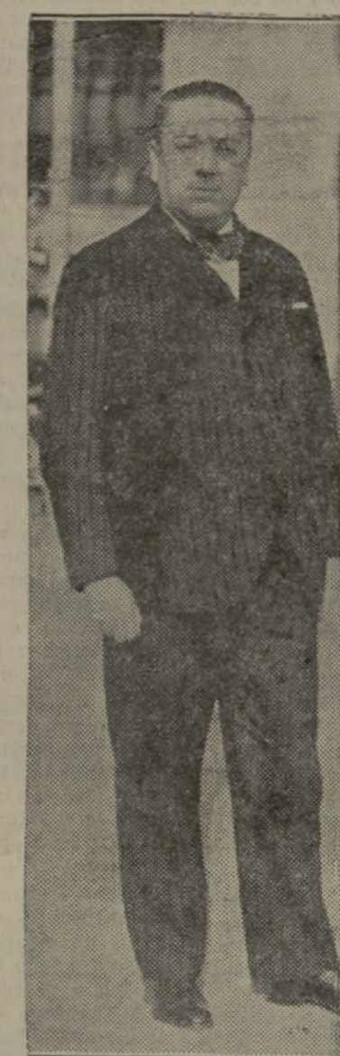
El ilustre ex ministro de la República, señor Martínez Barrios, que pronunció anteayer en Alcira un interesante discurso.

Una entusiasta ovación premió el discurso del señor Salazar Alonso.