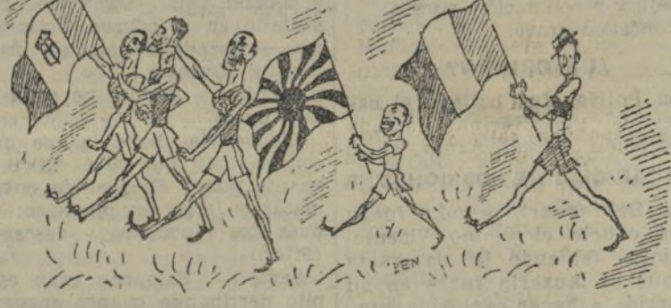
EL DESFILE DE LOS DEPORTISTAS POR EL ESTADIO DE LOS ANGELES

te, los escritores y poetas encontraban allí ocasión de dar a conocer sus obras, que se leían a los espectadores. Luego los vencedores-poetas se veían coronados del laurel simbólico, igual que los vencedores atletas.