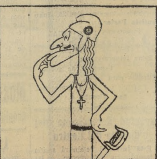
Y sale una República preciosa.