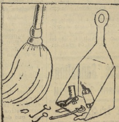
Se mezclan bien con restos de dictadura primeriverista.