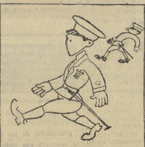
Media docena de militares flor delados.