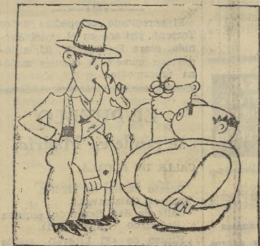
Se cogen cuatro latifundistas y aristócratas andaluces.