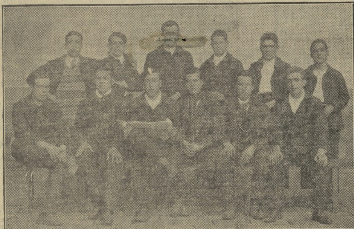
HE AQUÍ UNA JUVENTUD ABATIDA, EN EL PENAL DE SAN MIGUEL DE LOS REYES.—DOCE MOZOS CONDENADOS A PENAS TERribLES POR UN HECHO QUE A LO SUMO DEBERIA HABER SIDO CASTIGADO CON UN ARRESTO.—SE IMPONE QUE TODOS LOS HOMBRES DE SENTIMIENTOS PIADOSOS SE APRESTEN A SOLICITAR SU INDULTO

¡Y muchos de los que los juzgaron están complicados en la pasada intentona monárquica!