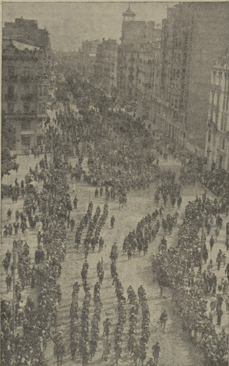
MOMENTO EN QUE LAS TROPAS DE LA GUARNICION OCUPAN LA AVENIDA DEL 14 DE ABRIL, PARA LA PARADA Y REVISTA, ACTO MILITAR CON QUE SE INAUGURO BRILLANTEMENTE EL DIA DEL EJERCITO