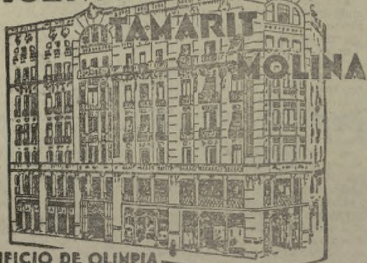
EDIFICIO DE OLIMPIA

Camas metálicas muebles de todas clases pianolas y rollos musica cochecitos para niños VICENTE