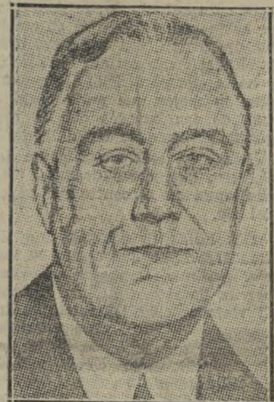
ROOSEVELT, NUEVO PRESIDENTE DE LOS ESTADOS UNIDOS

La federación de radicales socialistas, Orga, Acción y Esquerda, es ineficaz para conservar el Gobierno.