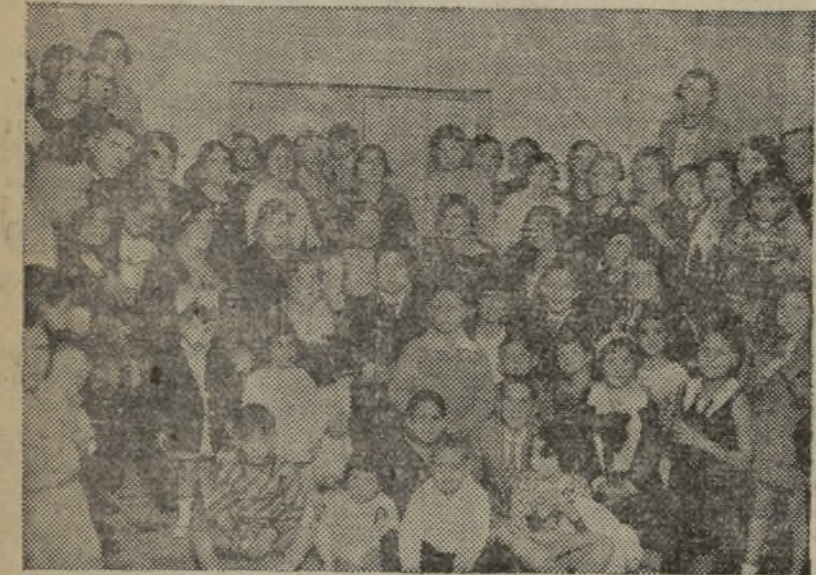
Ilustres damas que presidieron el reparto de meriendas a los hijos de los socios del Casino El Pueblo, rodeadas de la directiva de la Agrupación Femenina Republicana La Barraca, patrocinadora de tan hermoso acto

dad, por la popularidad que se le rodeó y por las personas que contribuyeron a su esplendor, fué dicho acto uno de los que mejor retratan el espíritu ciudadano que siempre ha sido norma de conducta de tan incansables republicanas.