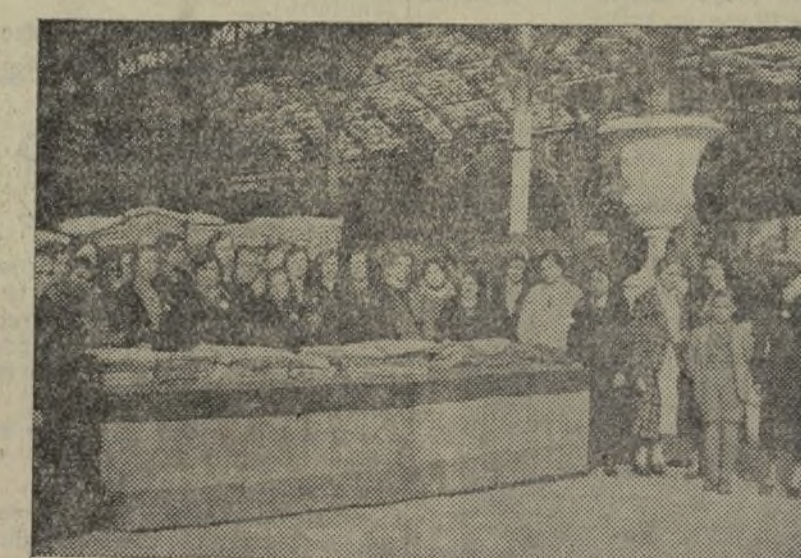
LAS AGRUPACIONES FEMENINAS DEL PARTIDO DE UNION REPUBLICANA AUTONOMISTA, MOMENTOS ANTES DEL REPARTO DE MANTAS A LAS FAMILIAS POBRES.