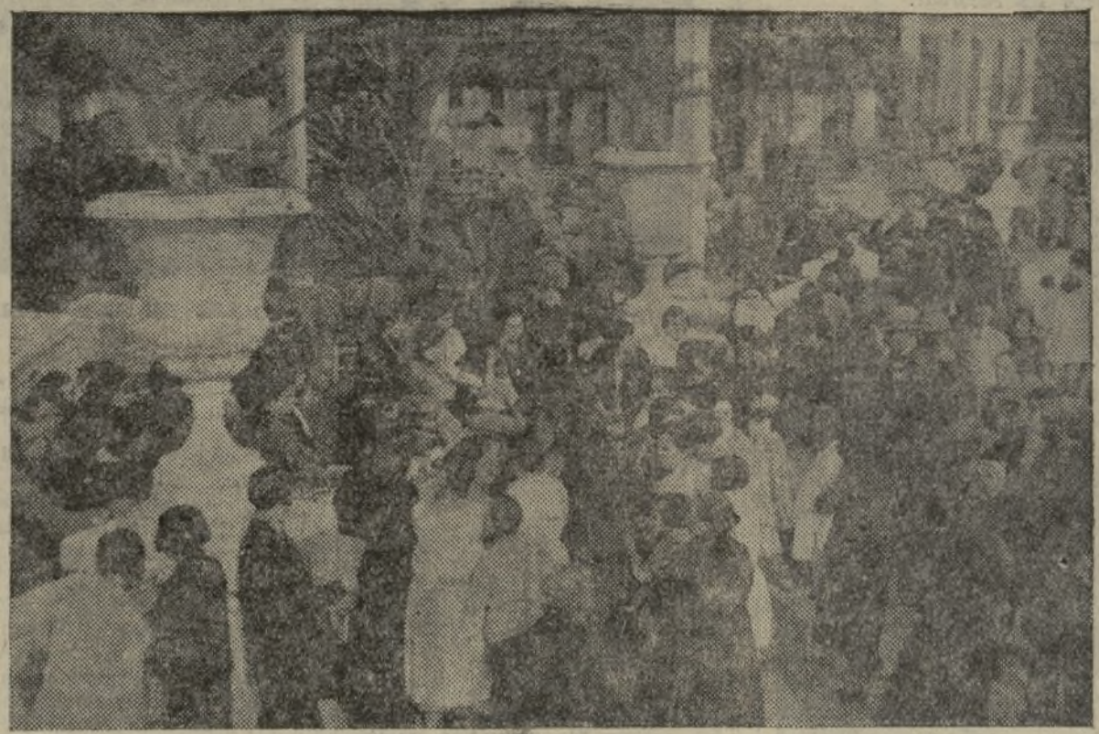
MOMENTO CULMINANTE DEL REPARTO DE MANTAS A LAS FAMILIAS POBRES POR EL ROPE-RO AUTONOMISTA REPUBLICANO.—ACTO CELEBRADO EN LOS VIVEROS MUNICIPALES

Se repartieron ropas y mantas entre los necesitados