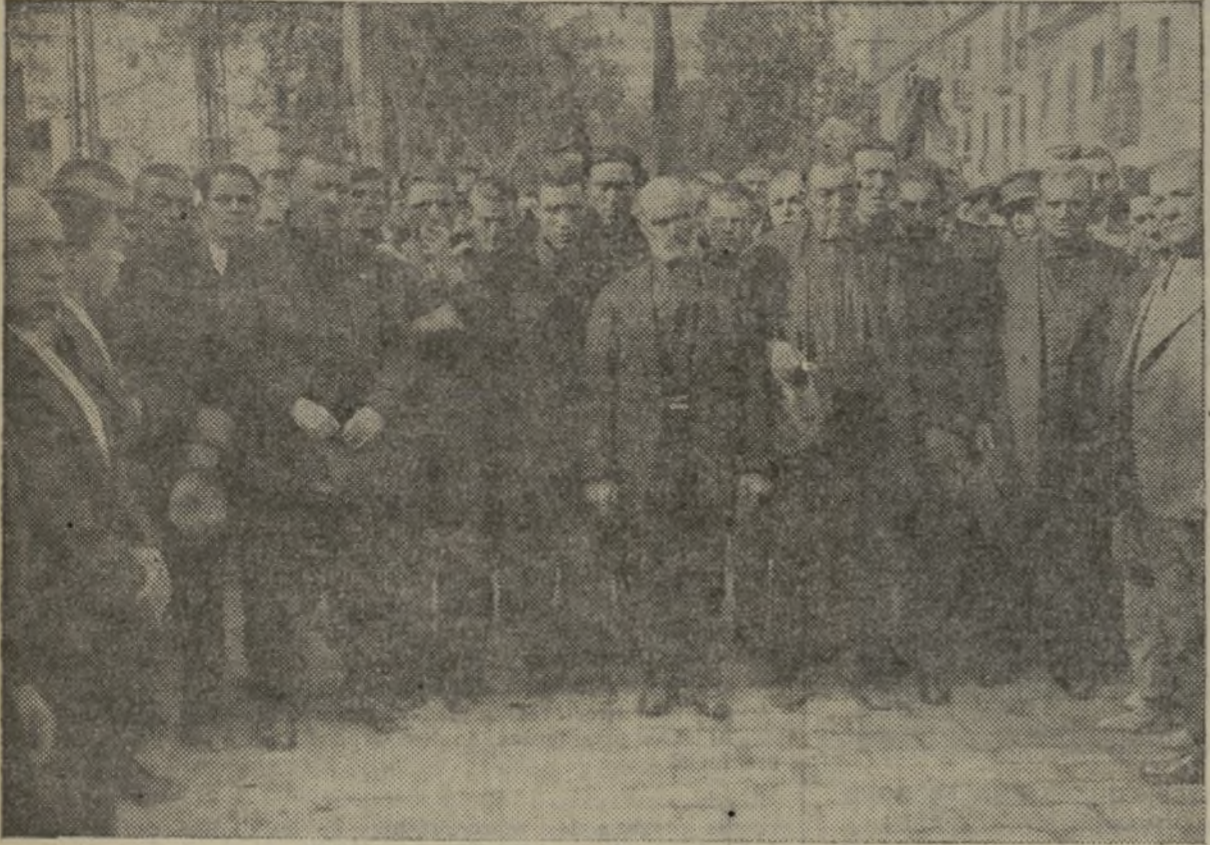
LAS FAMILIAS DE LAS VÍCTIMAS Y REPRESENTACIONES DE LA GENTE DE MAR, PROFUNDAMENTE AFECTADA POR LA DESGRACIA.