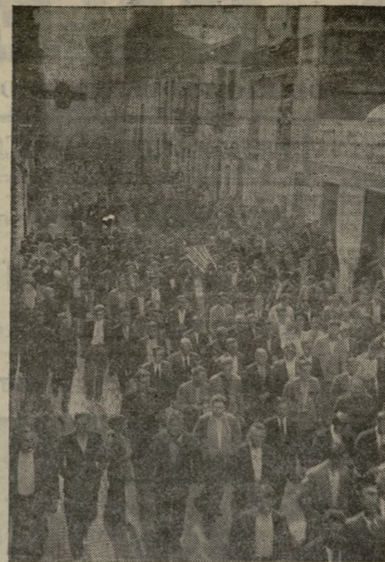
PASO DE LOS FERETROS POR LAS CALLES DE LOS POBLADOS MARÍTIMOS

La comitiva recorrió el siguiente itinerario: Avenida del Puerto,