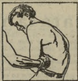
CONTRA LOS GOLPES y contusiones del deporte, como los que se producen en casa o en el trabajo, vena el dolor, aplicando este frasco Linimento de Sloan.