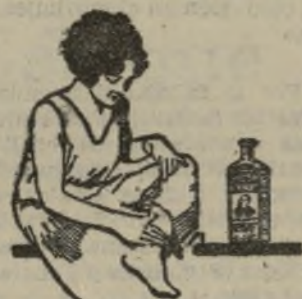
LAS TORCEDURAS deben curarse pronto y completamente. El Linimento de Sloan alivia el dolor, evita que se endurezcan los tejidos y prepara al pronto restablecimiento.