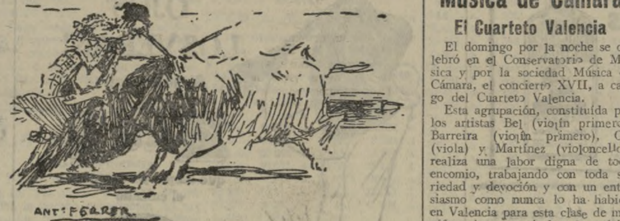
VICENTE FERNANDEZ ENTRANDO A MATAR AL PRIMER NOVILLO

La empresa de la plaza organizó para el pasado domingo — y desde luego se celebró el festival — una novillada que intituló «regional» porque los tres aspirantes a ases eran valencianos. Con ello seguramente la empresa habrá cumplido con esos inevitables compromisos que les crea