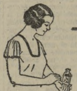
DOLOR REUMÁTICO Siempre que se presente, atáquelo en seguida con Linimento de Sloan. Penetra sin frotar y deja un grato cosquileo.