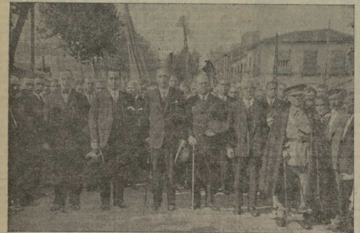
PRESIDENCIA DEL DUELO EN EL ENTIERRO DE LAS VÍCTIMAS DE LA BARCA «GRAO».

Las citadas solicitudes se presentarán dentro del plazo señalado, al señor director de la escuela. La prueba-oposición para la adjudicación de la pensión tendrá lugar a las cuatro de la tarde del día 19 del corriente mes de Noviembre. — Por el Patronato, José Medio.