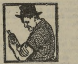
MUSCULOS-CANSADOS Pueden hacerse desaparecer rápidamente su dolor y su molestia con el Linimento de Sloan.

El Linimento de Sloan quita casi inmediatamente cualquier dolor neuralgico, reumático o muscular, es decir, que se presente sin herida.