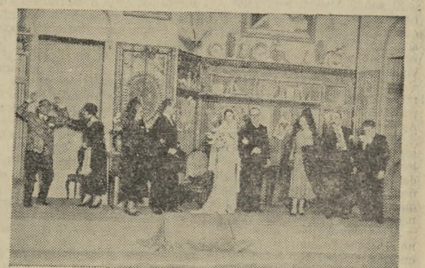
FINAL DEL PRIMER ACTO DE «UN HOME DE SORT», ESTRENADO ANOCHES CON GRAN ÉXITO EN EL «TEATRE VALENCIA»

Con un primer acto semejante, subida cuesta esperaba a los autores, pero no son los hermanos en