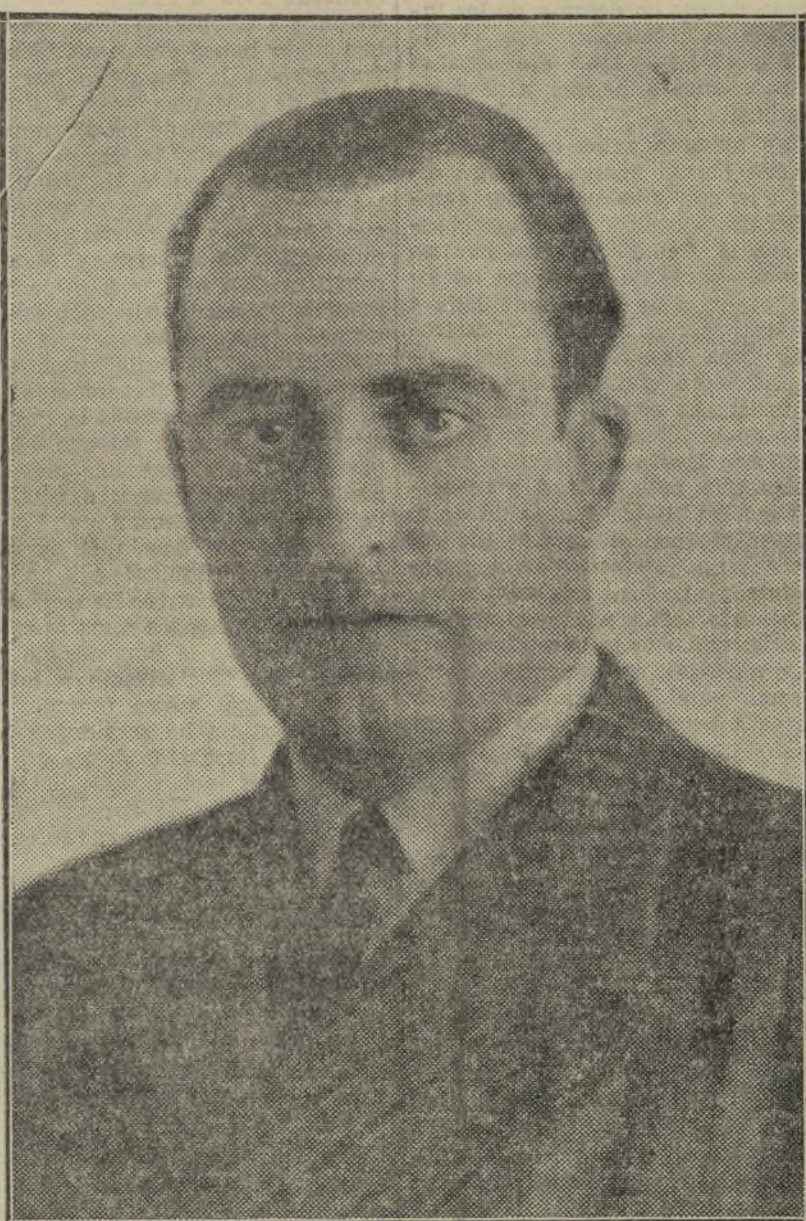
DON SIGFRIDO BLASCO, QUE EL DOMINGO FUE REELEGI- DO PRESIDENTE DEL CONSEJO FEDERAL DEL PARTIDO DE UNIÓN REPUBLICANA AUTONOMISTA, POR FERVOROSA ACLAMACION

La provincia, esa Valencia rural, venero de las más ricas actividades de la esencia vital de nuestro pueblo, se asoció con abrumadora proporción a la Asamblea, estableciendo una afinidad rotunda con la capitalidad. La industria y el agro se han hermanado al conjunto de una grandeza, la grandeza blasquista, única fuerza milagrosa, capaz de acogerla en amplio estadio a su ideal.