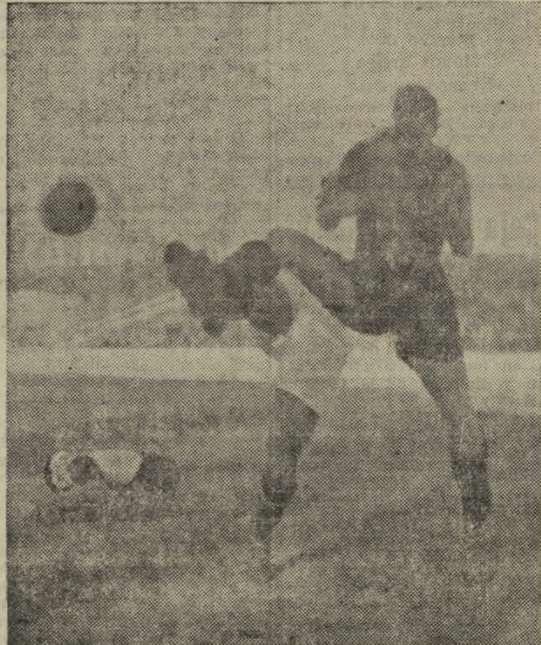
EL SEGUNDO GOAL DEL VALENCIA

portivo Alavés: se le creía deshecho. Pues, bien; los vitorianos debutan metiéndole ocho tantos al Racing de Santander, uno de los más peligrosos equipos de la división.