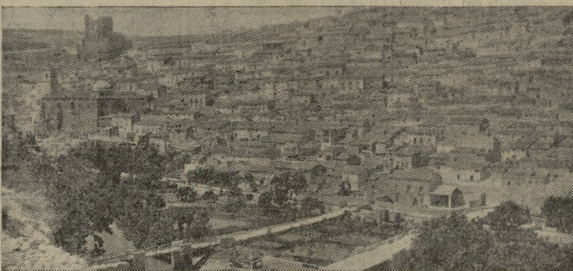
VISTA GENERAL DE ALCALA DEL JUCAR

El primero cuyo mote llegó a nosotros, fué el vecino conocido por «Mondejas», su mujer y sus dos hijos. El vecino conocido por «Guerra», su mujer y una hija.