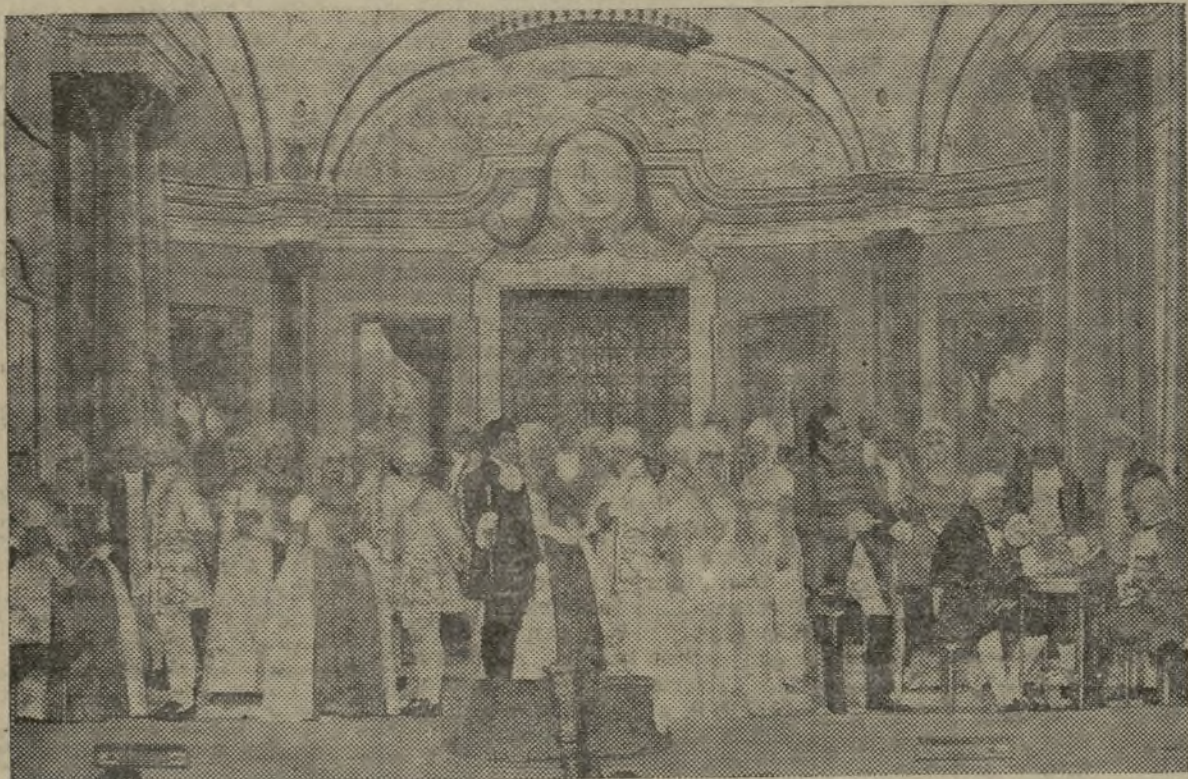
UNO DE LOS MOMENTOS MAS INSPIRADOS DE LA PARTITURA. LA PARTIDA DE CARTAS DEL CUADRO SEGUNDO DEL ACTO PRIMERO.

Y tras caldearse el ambiente, al alzarse el telón, de nuevo la ovación sonó atronadora ante la fas-