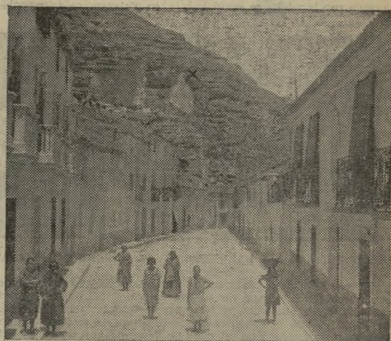
AL FONDO, EL PEÑON QUE AL DERRUMBARSE HA CAUSADO LA TRAGEDIA