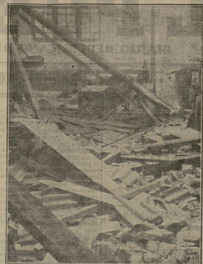
ASPECTO QUE PRESENTABA LA NAVE DE MAQUINAS DE LA FABRICA INDUSTRIAS ZACARIAS, QUE SUFRIÓ GRANDES DAÑOS A CONSECUENCIA DEL HUNDIMIENTO DE LA CUBIERTA DE UN EDIFICIO EN CONSTRUCCION EN LA CALLE DE LA INDUSTRIA

Acompañará a la comisión que marchará a Villanueva de Castellón, una representación de las agrupaciones femeninas del Partido de Unión Republicana Autonomista.