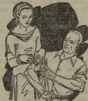
Dolor en las articulaciones Calambres

El LAPIZ TERMOSAN es el Revulsivo más práctico y eficaz contra toda clase de dolores y congestiones.