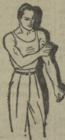
Fatiga muscular Golpes-Torceduras