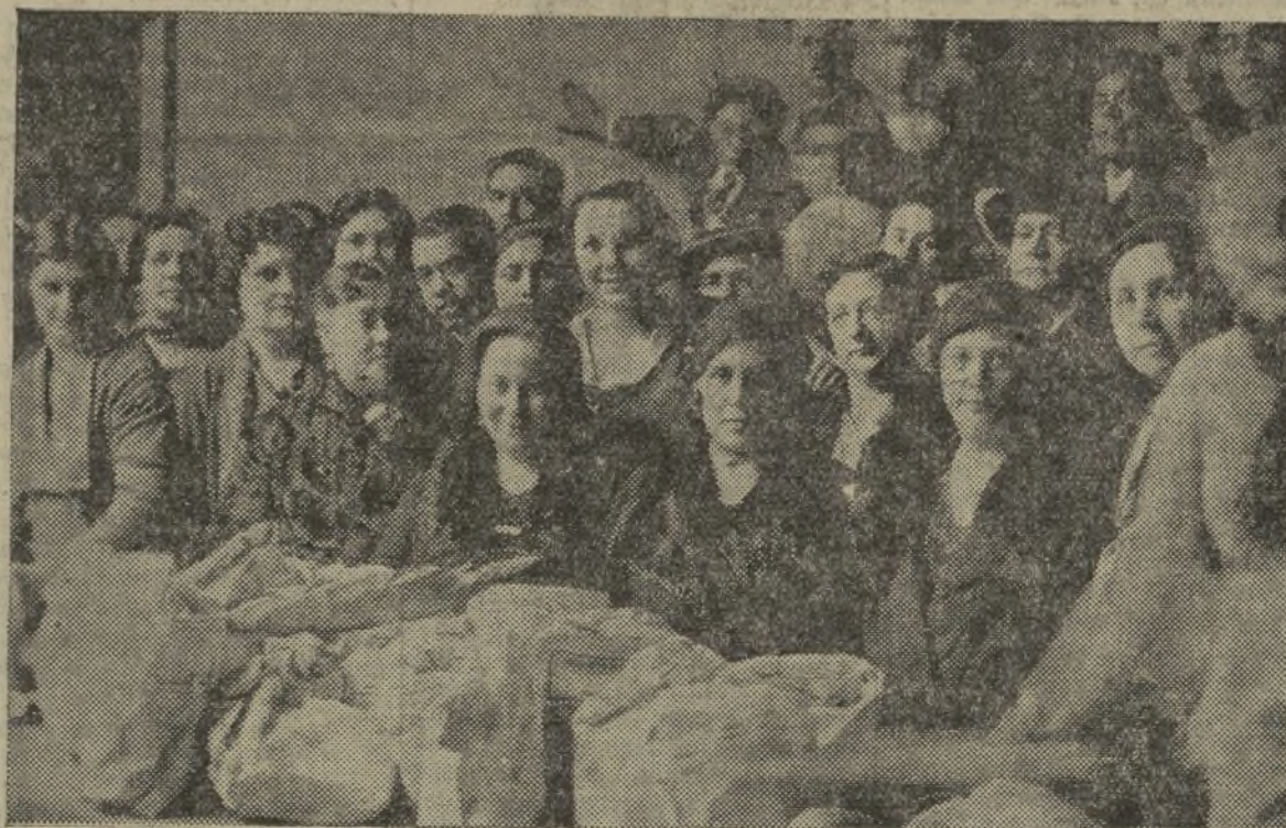
LA PRESIDENCIA DE LA MESA Y DIRECTIVA DEL ROPERO DISPONIENDOSE A COMENZAR LA DISTRIBUCION DE COCIDOS.