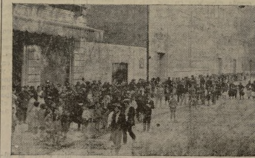
LA INTERMINABLE COLA QUE DURANTE CINCO HORAS ASEDO LA CASA DE LA DEMOCRACIA.

La casa Francisco Arborea, de Alcira, participa a los que usen indebidamente marcas cuyo elemento principal sea una CRUZ o la denominación de ésta, que a partir del día 1.º de Enero de 1933, procederá judicialmente contra los que imiten su marca número 81.493 Española y la número 74.204 Internacional, de las que es propietario; reclamando las indemnizaciones y perjuicios que hubiere lugar.