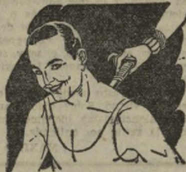
Rigidez del cuello Torticollis