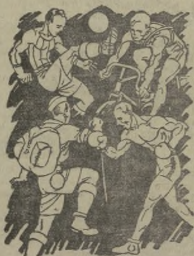
Indispensable para toda clase de sports. No ocupa sitio ni es frágil