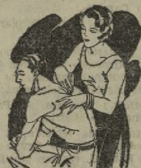
Artrismo Dolores de muñeca y brazos Dolores de espalda y riñones

El LAPIZ TERMOSAN se vende en todas las Farmacias y Centros de Específicos Tubo grande; 4.45 ptas. - Tubo pequeño; 3.- ptas., timbres incluidos