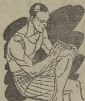
Reuma - Clática Golpes

Preparado en forma de una barrita de facilísimo empleo. Se aplica rápidamente tal como se presenta y sin tener que ensuciar-se las manos.