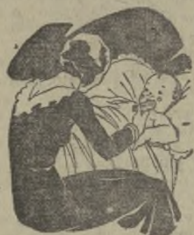
Tos - Catarros - Bronquitis Congestiones