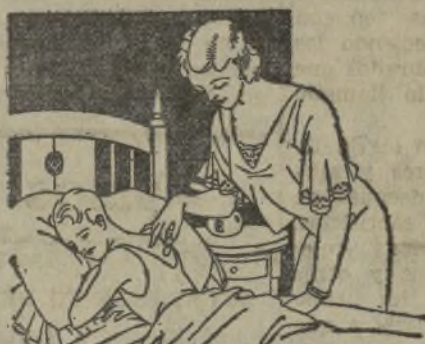
Resfriados - Asma - Pleuresías Congestión pulmonar