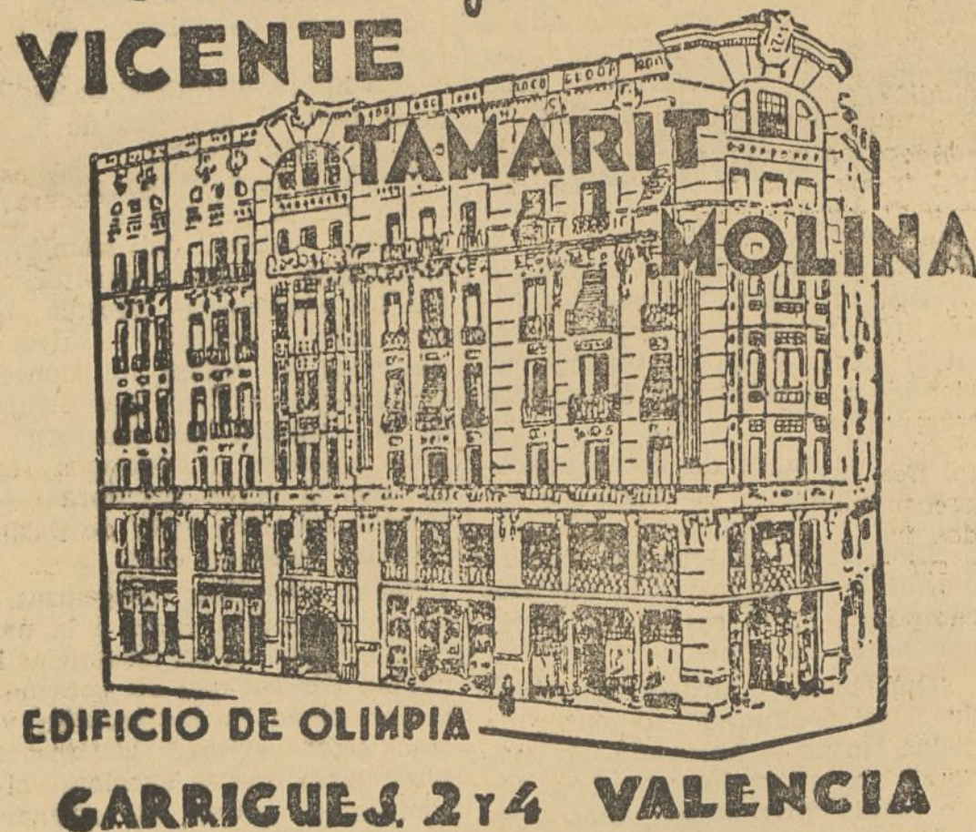
EDIFICIO DE OLIMPIA GARRIGUES, 2 y 4 VALENCIA

camas metálicas muebles de todas clases pianolas y rollos musica cochecitos para niños VICENTE