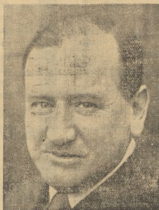
MR. EDUARDO DALADIER presidente del Consejo de Francia

Por tan fausto acontecimiento felicitamos a los padres del recién nacido, deseándole dichas sin fin.