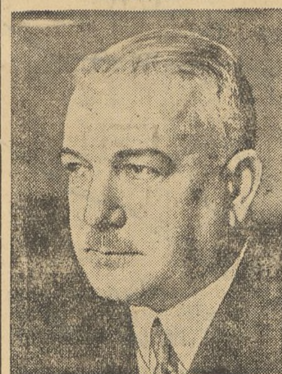
MR. VON NEURATH ministro de Negocios Extranjeros de Alemania

PERSONAS IMPORTANTES DE LA CONFERENCIA ECONOMICA UNIVERSAL