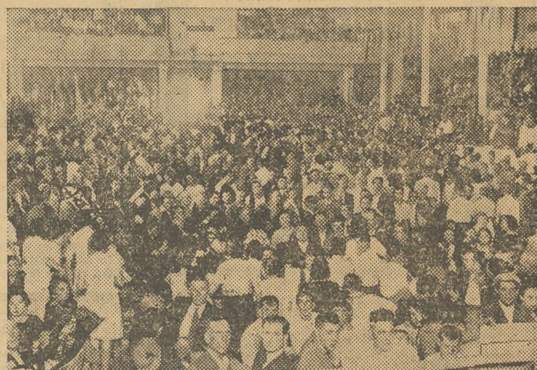
UN ASPECTO DEL HERMOSO TEATRO DE ALCIRA, DURANTE EL MITIN PRO ESTATUTO

Terminó leyendo una poesía ensalzando la personalidad valenciana.