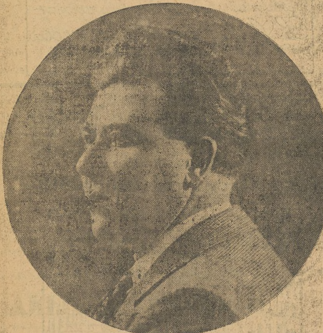
BENVENUTO FRANCI, primer barítono del mundo que cantará en los Viveros el domingo «El Barbero de Sevilla» y el jueves 27 «Rigoletto»

Del jueves al viernes llegarán todos los artistas.