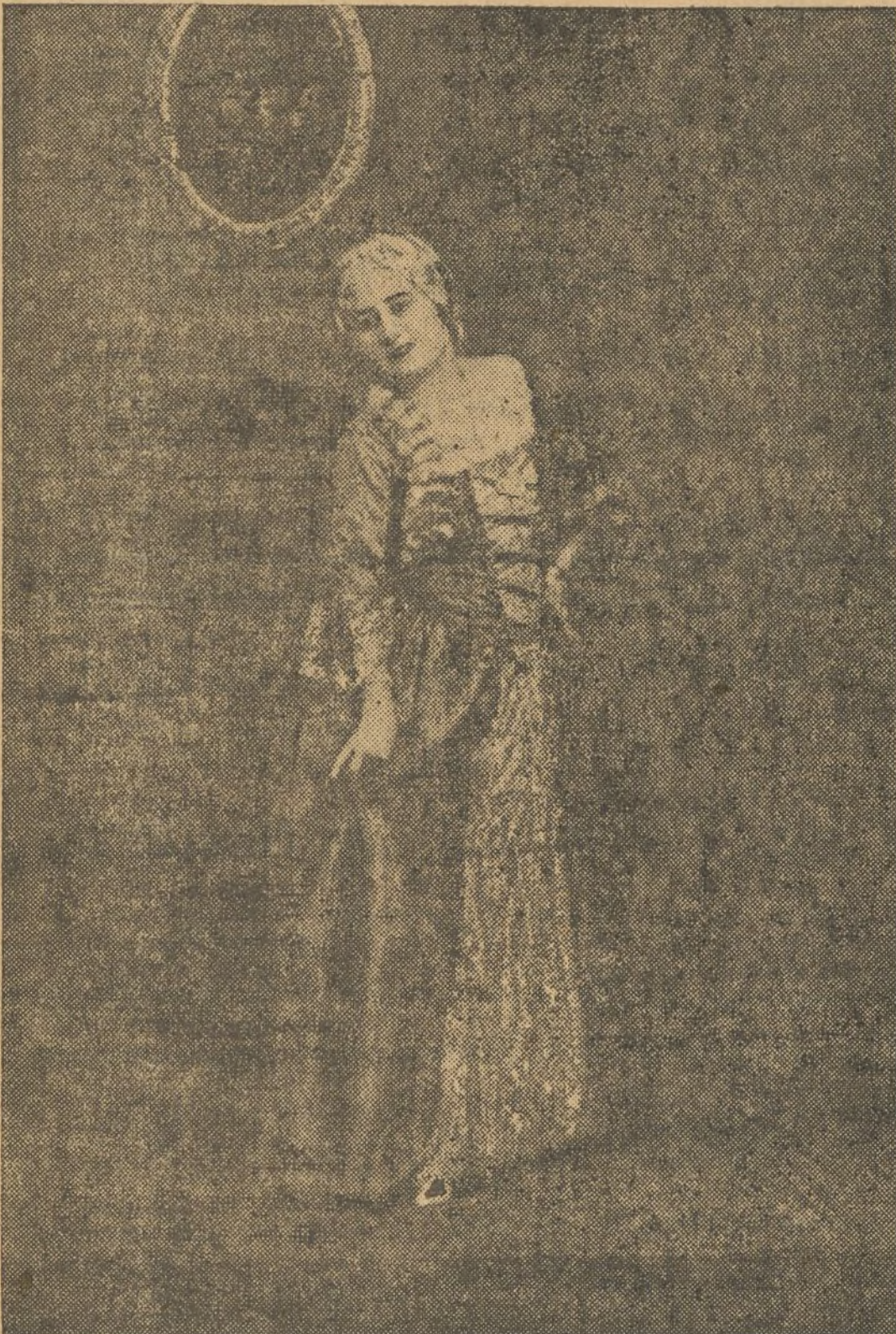
MERCEDES CAPSIR, la eminentísima diva de fama mundial que el domingo cantará en los Viveros el «Barbero de Sevilla» y el jueves 27 «Rigoletto»

Estamos dentro de la gran semana, la que precede al gran acontecimiento lírico que va a celebrarse. Pronto comenzarán los ensayos. El maestro Podestá salió de Milán el sábado en automóvil con