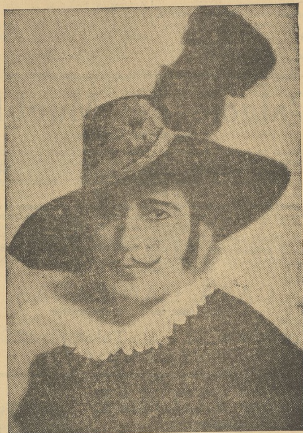
PIERO BIASINI, primer barítono del teatro Scala de Milán, notable artista que cantará «Carmen» el martes 25 y «Bohème» el sábado 29

Otro de los acontecimientos lo constituirá el debut del primer tenor del teatro Scala de Milán, Antonio Melandri, de portentosas facultades, de espléndida voz, que ha conseguido ser conside-