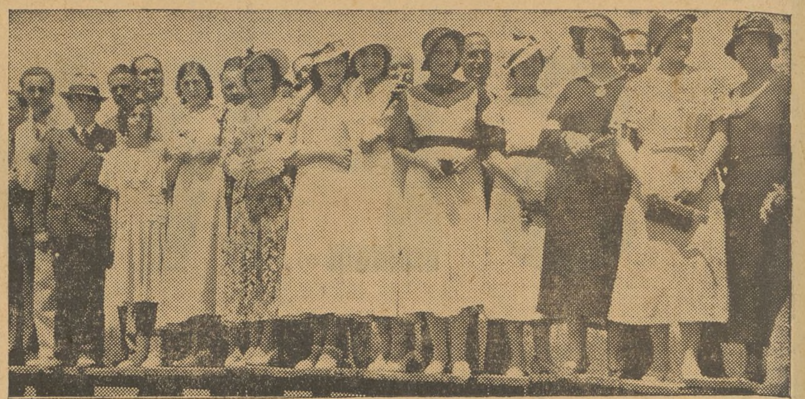
Las bellezas representantes de Aragón y Valencia, durante la excursión realizada ayer mañana en la Dehesa