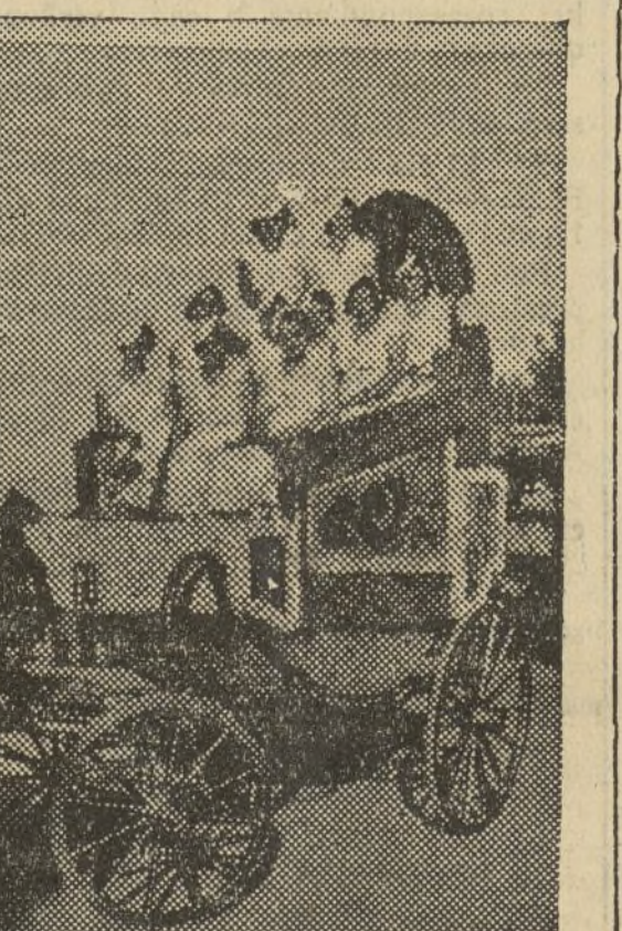
Carroza Casa de la Democracia

la de Valencia con su música fuertana desfiló y todo el público batió palmas lleno de júbilo, y los vivas a Valencia y Aragón surgieron de mil gargantas, cuando la lucida cabalgata pasó ante las tribunas de los invitados aragoneses y donostiaras. Después del desfile de las carrozas comenzó la batalla, en la que se hizo un verdadero derroche de flor.