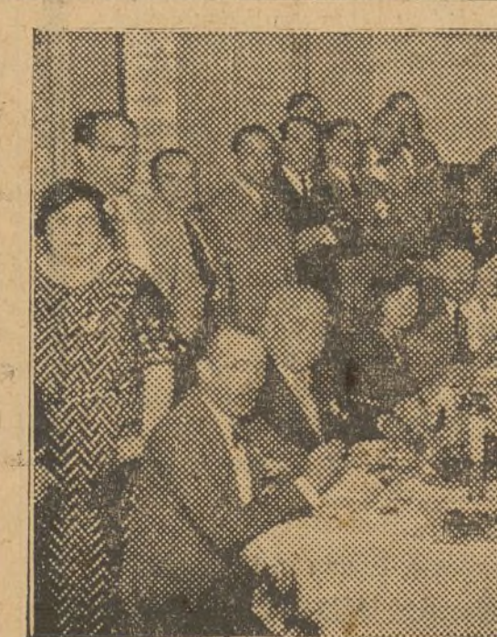
Los comisionados aragoneses durante su visita al Centro Aragonés, donde fueron obsequiados con un vino de honor

Procurador de los Tribunales de resolverá sus pleitos y cobros de créditos Colón, 82 — Teléfono 11.070