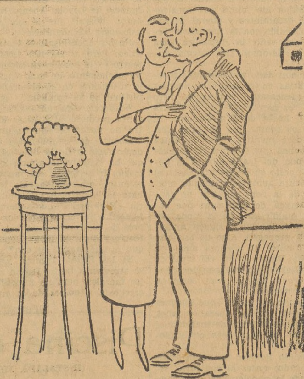
—¡Ver Nápoles y morir, querido! —¿Cuándo quieres marchar?

Para fin de fiesta se elegirá Miss Benimámet 1933.