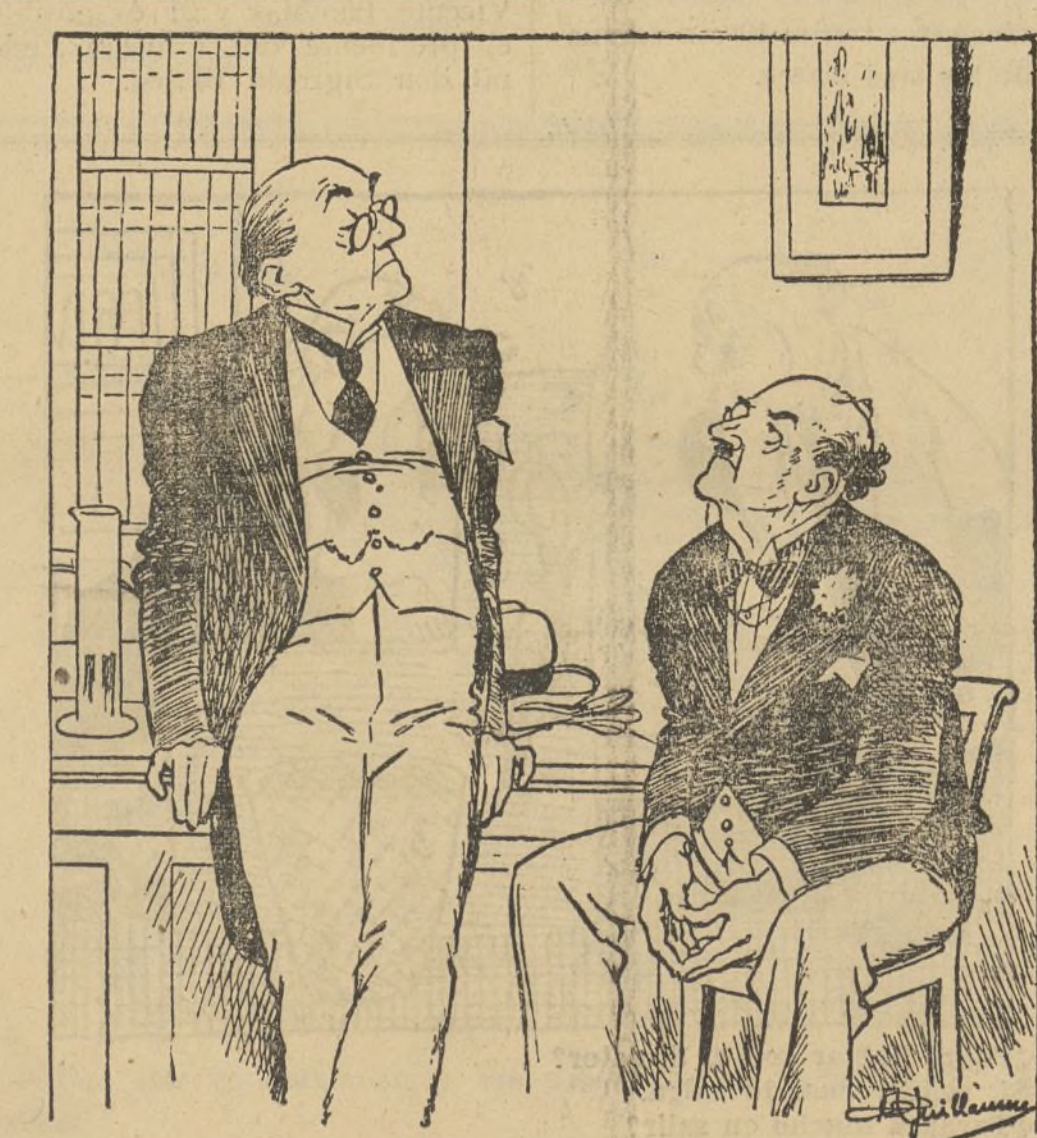
—Entonces, ¿qué cree usted que tengo, doctor? —Setenta años.

Advertimos, pues, a los correligionarios para que no dejen sorprender su buena fe.