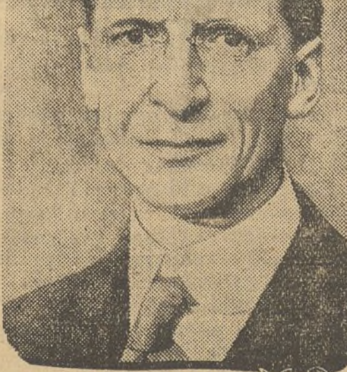
EAMON VALERA presidente de la República de Irlanda, tan agitada en la actualidad por la organización fascista de las «camisas azules».

He aquí lo que dice el telegrama: «Ante el sinnúmero de peticiones mediante telegramas y cartas dirigidos desde Valencia al Gobierno para resolución del asunto de la Siderúrgica del Mediterráneo, que llega a un final trágico, haciéndose cada día más inminente el cierre definitivo de esa factoría, nos hemos entrevistado con varios ministros, con la esperanza de que en el Consejo de hoy se hubiera tratado de esta cuestión, según había asegurado el ministro de Agricultura, cuando a su regreso de Castellón el pasado domingo estuvo unos mo-