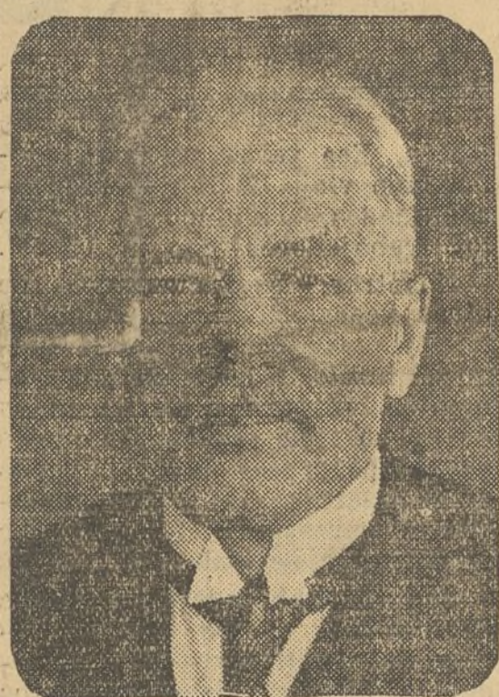
IGNACIO MOSCICKI presidente de la República polaca, que tras la reforma de la Constitución ha visto notablemente ampliados sus poderes.

Reconocidos al selecto colega barcelonés que, además, publica un sentidísimo artículo de nuestro antiguo amigo don Miguel Rojano, dedicado a Blasco Ibañez.