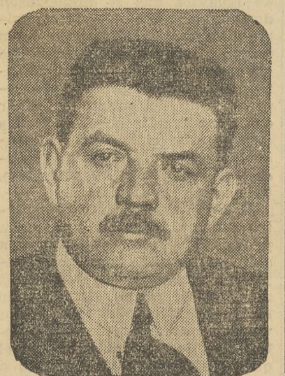
EDUARDO HERRIOT, ex jefe del Gobierno francés, cuyo viaje a Rusia encierra la mayor importancia para la cuestión política europea.

—Otros hechos los recuerda todo el mundo. Las detenciones de Alcalá Zamora y otros elementos del comité revolucionario; los odio