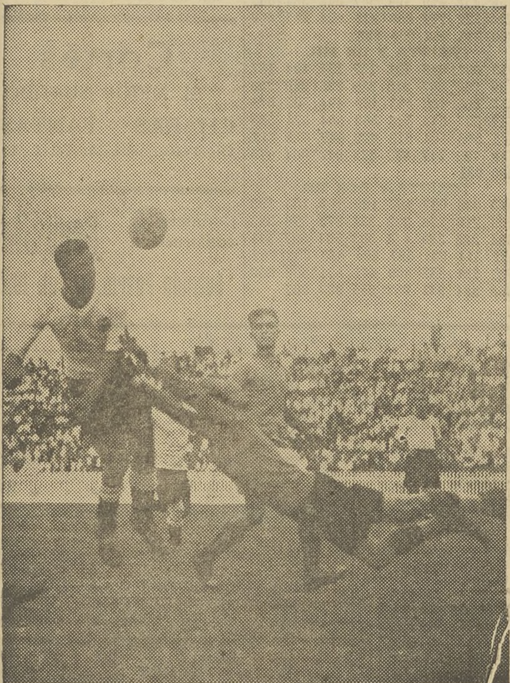
EL PRIMER GOAL DEL VALENCIA

Esperaremos aún más, antes de emitir ningún juicio definitivo sobre el «nuevo» Valencia. La falta, hasta ahora, de enemigo, corta por completo el comentario. Cualquiera alineación valencianista hubiese dado fin de sus contrincantes.