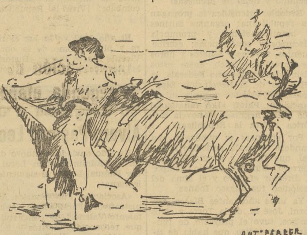
MANOLETE LANCEANDO DE CAPA A SU PRIMERO

tanto que recibió un revolcón serio y pudo ver entonces que todavía quedaba mucho que hacer con el animal.