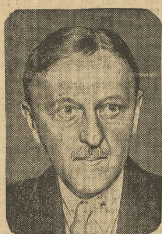
MISTER WILLIAM WOODIN ministro de Hacienda de Norteamérica

Navarrés, Novell, Onteniente, Otos, Palmera, Palomar, Petrés, Pica-