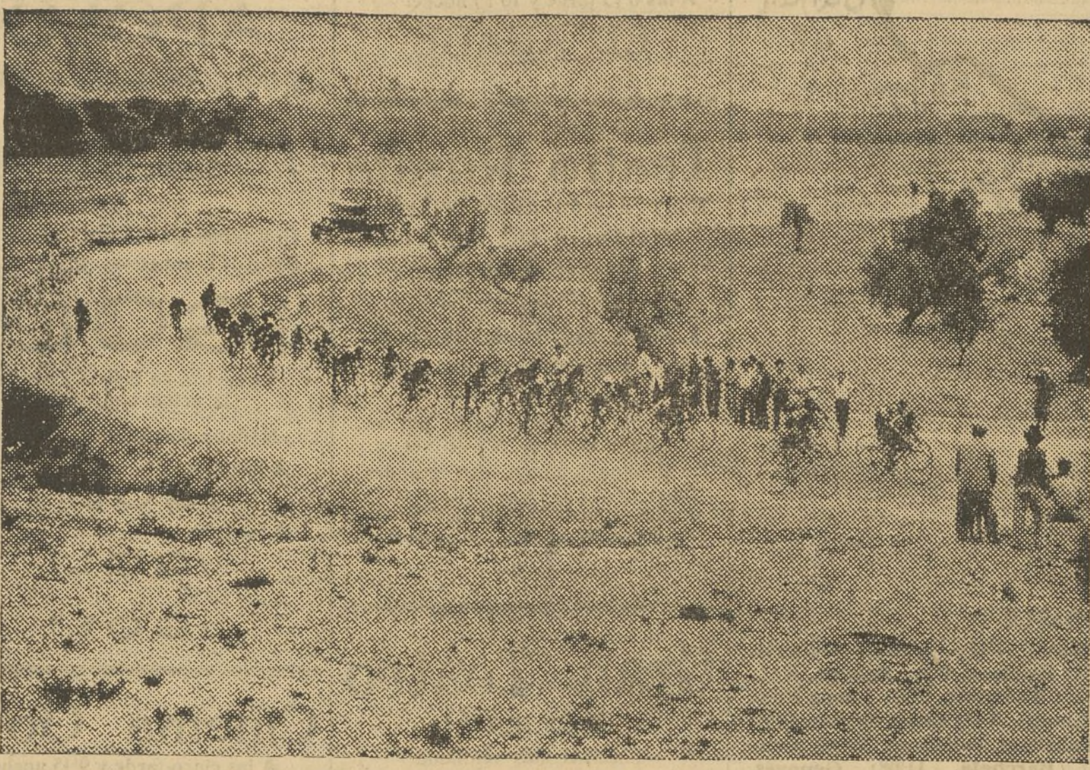
El momento más duro de la etapa de ayer. Los corredores comienzan a subir la Carrasqueta