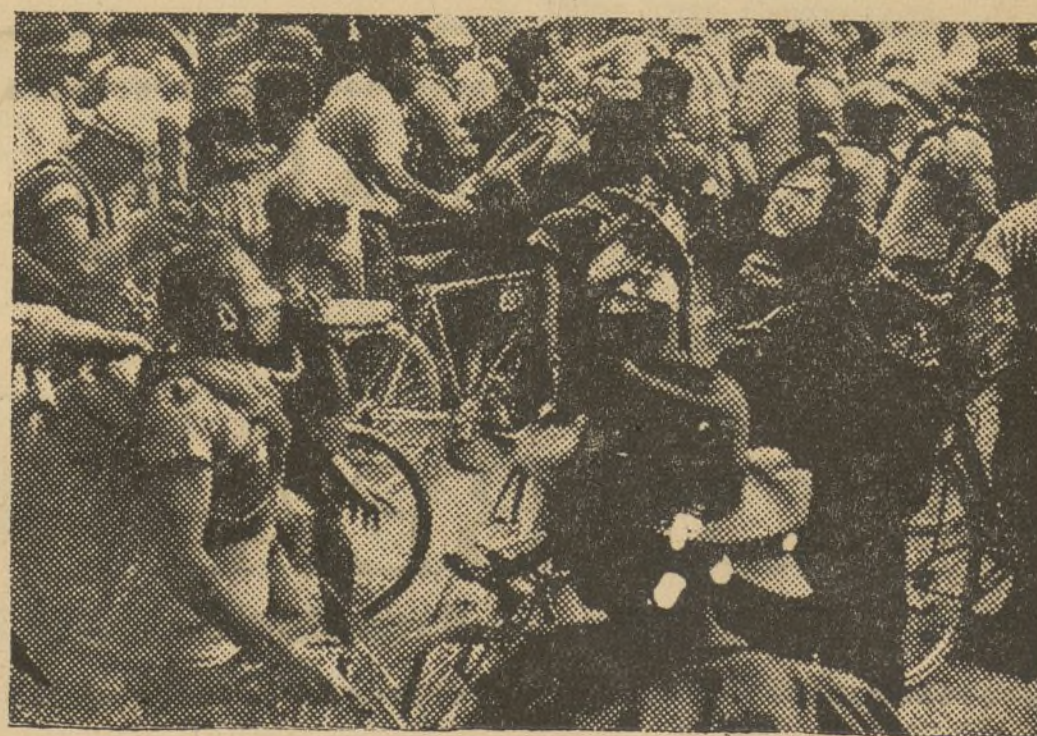
Una escena pintoresca del control de Murcia