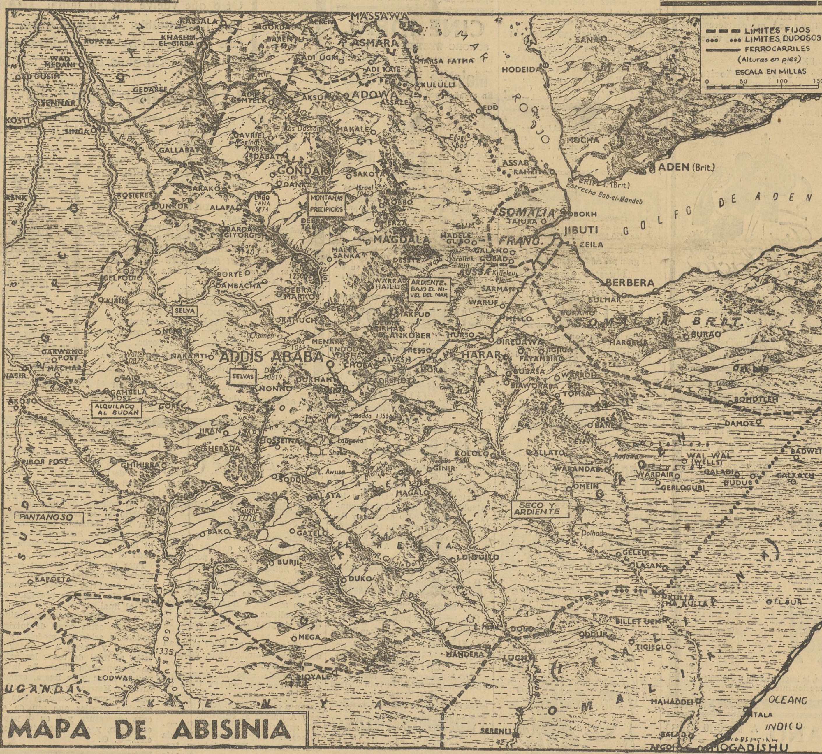
MAPA DE ABISINIA

Queda justificada, ante tan abominable proceder, una nueva invasión de los bárbaros que avente hasta las cenizas de una civilización tan criminal y que haga caer la sangre inocente derramada sobre la cabeza de los culpables y de sus descendientes hasta la quinta generación, y aún nos parece poco.