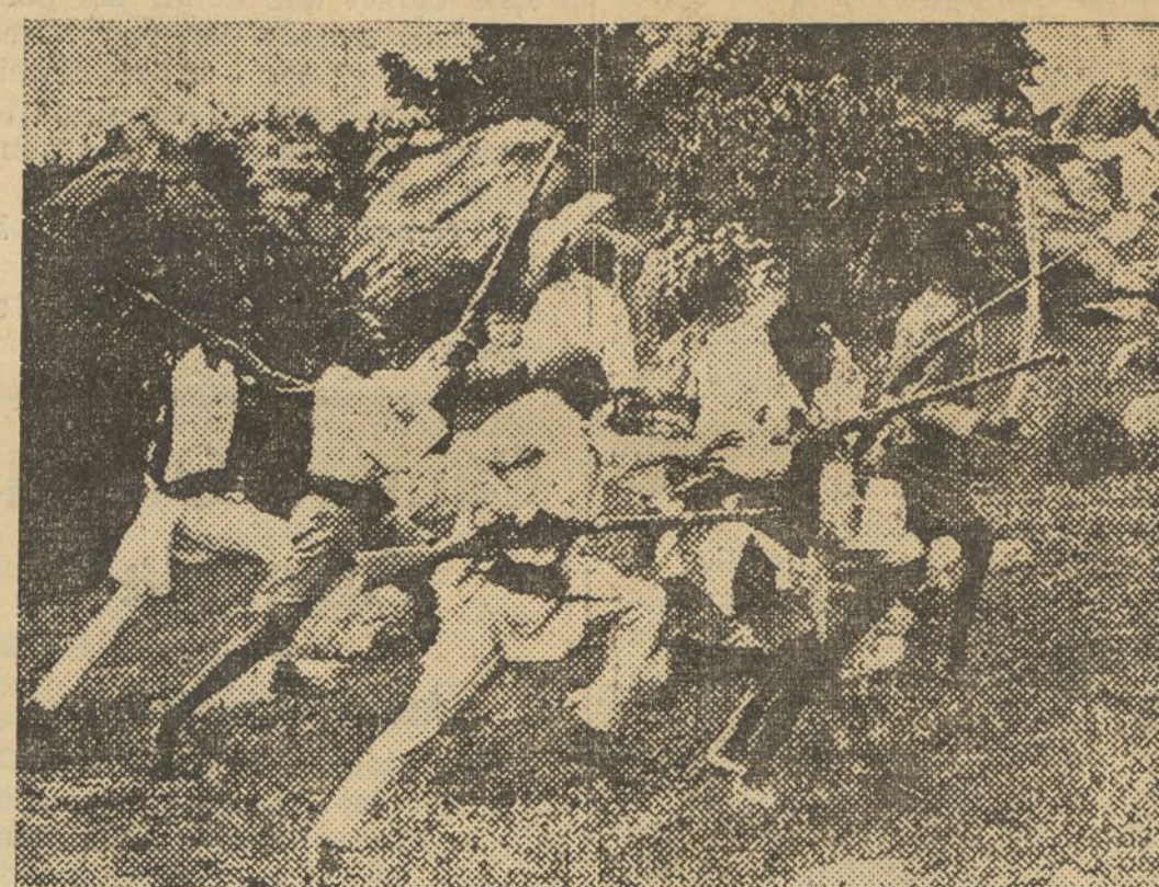
Cómo van a la guerra los voluntarios o guerrilleros abisinios. Estos van a la lucha cantando y riendo escandalosamente. Quieren enfrentarse con el enemigo. Esta foto ha sido tomada al Sur de Harrar, hace ocho días

Addis Abeba.—Ha circulado insistentemente el rumor de que los italianos, a consecuencia de la de-