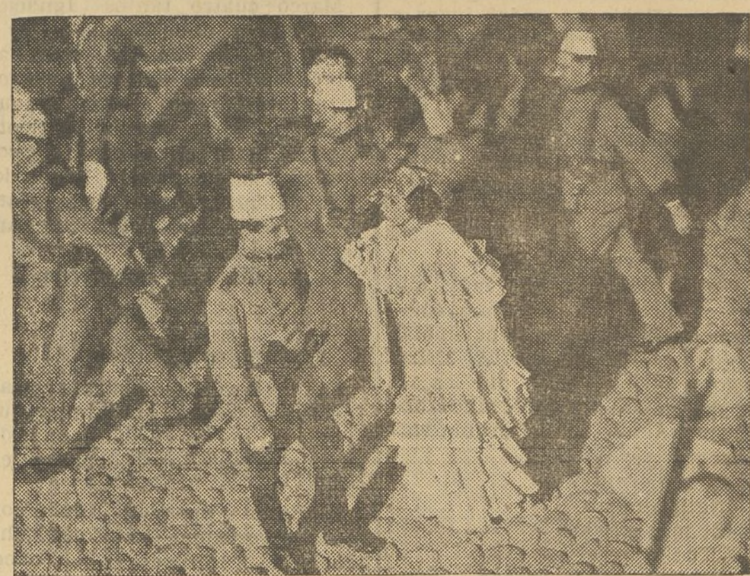
Una escena del magnífico film de la E. I. P. «Abdul Hamid» (El sultán maldito), que próximamente presentará CIFESA en el cine Olympia

EMOCION MAXIMA LA NOVIA DE FRANKENSTEIN (HABLADA EN ESPAÑOL)