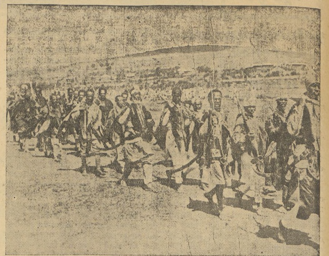
Tropas irregulares del desierto, pertenecientes al ejército del ras Nassibu, saliendo de un campamento, a treinta millas al Sur de Harrar, para el frente Sur

(Sigue esta información en la sección telegráfica)