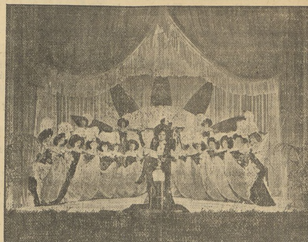
UNA MAGNIFICA PRODUCCION B. I. P. «ABDUL HAMID», QUE EL PROXIMO LUNES PRESENTA CIFESA EN EL CINEMA OLYMPIA

Tres lanceros bengalíes Es un film PARAMOUNT