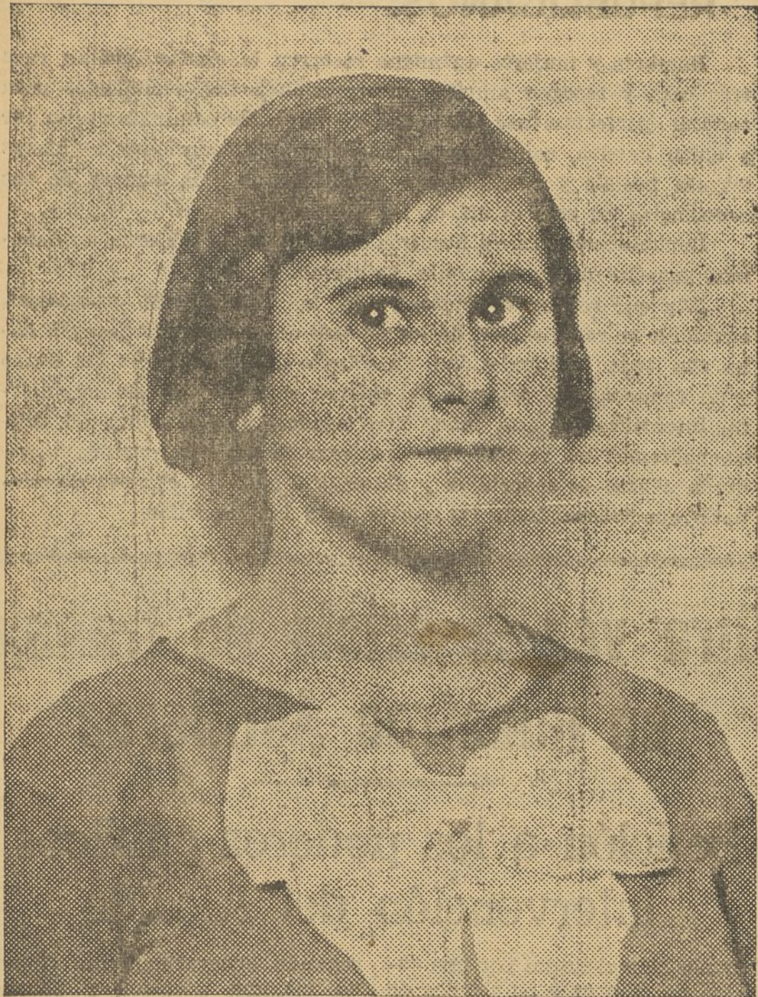
La niña hallada en Venta Cabrera, que fue robada a sus padres, tiene hoy dieciséis años

A partir de aquel instante, había nacido entre tales gentes Jo