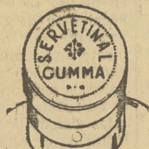
Fig. núm. 1

Esta cápsula es plateada por los lados y granate en su parte superior, con una inscripción en relieve formada por el mismo metal de la cápsula que dice: «SERVETINAL GUMMA»; la palabra SERVETINAL de forma circular y la palabra GUMMA recta, debajo de la que dice SERVETINAL. Véase figura núm. 1