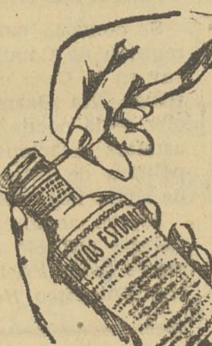
Fig. núm. 3

En su parte lateral, adaptada al cuello de la botella, se ha practicado un corte con dos puntas, tírese por cualquiera de ellas y entonces queda la cápsula convertida automáticamente en un tapón de rosca. Véase figuras números 3 y 4