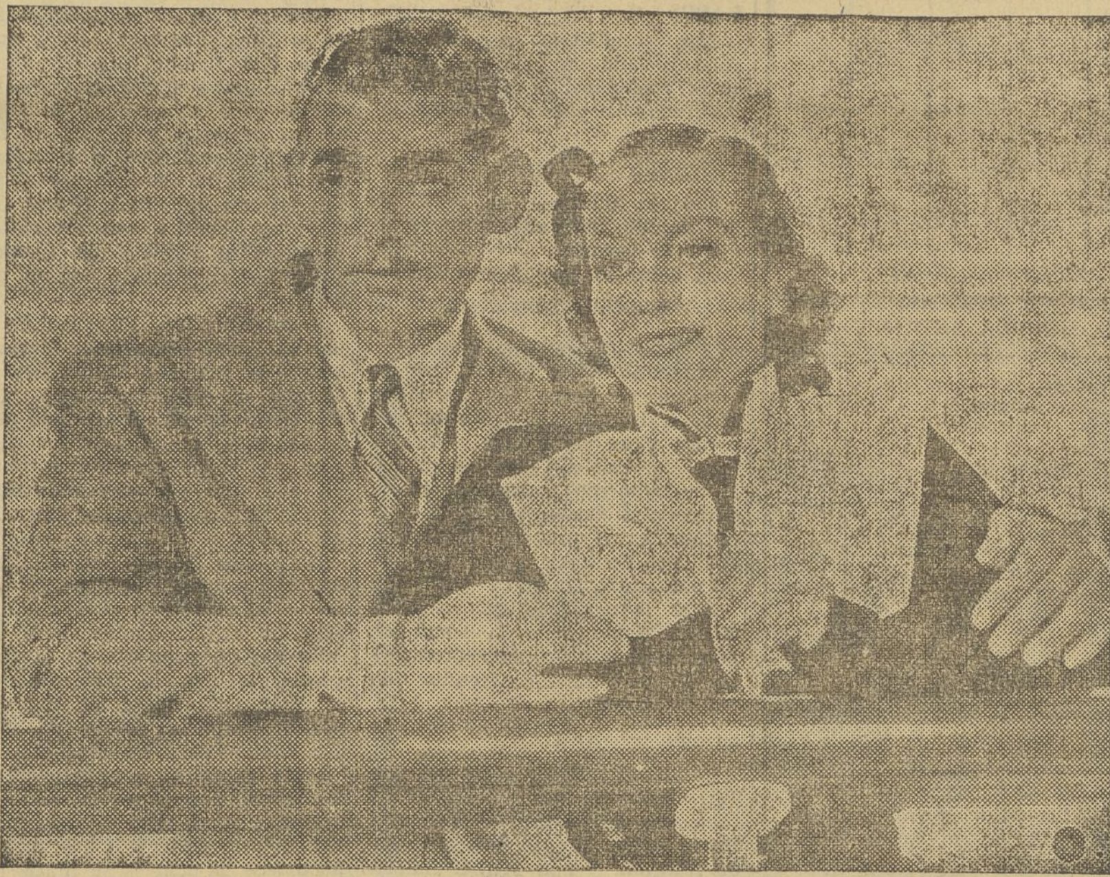
JOAN CRAWFORD Y CLARK GABLE EN UN MOMENTO DEL FILM «CUANDO EL DIABLO ASOMA», QUE EL PRÓXIMO LUNES NOS DARÁ A CONOCER EL Suntuoso CINEMA CAPITOL

Debuta en «El delator» la famosa estrella inglesa Margot Grahame, secundada por Heather Angel y por Preston Foster. «El delator» es el estreno que aparecerá en breve en un suntuoso cinema de nuestra ciudad.