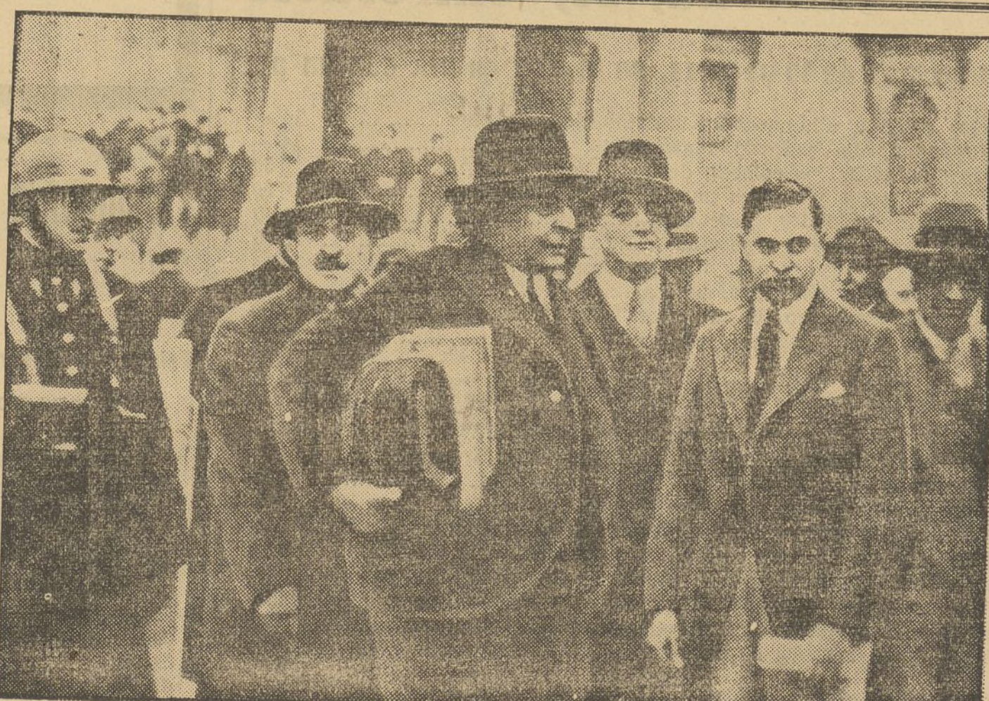
LOS DEFENSORES DE LOS COMPLICADOS EN EL ATENTADO DE MARSELLA

(Sigue esta información en la sección telegráfica.)