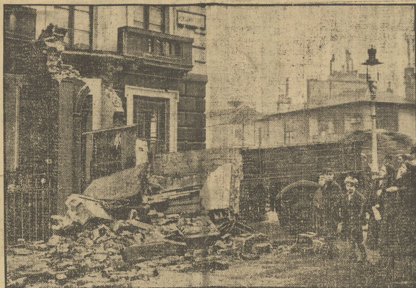
UN AUTOCAMION CHOCA CONTRA UNA CASA

Londres. — En una curva, un autocamión con remolque, cargado con diez toneladas, se desprendió de éste y chocó contra una casa. Todo un mirador saliente fué destruido y el camión quedó metido en la casa. Como cosa extraordinaria hay que señalar que ni dos personas que iban en el camión, ni otras tres de la entrada de la casa, resultasen heridas