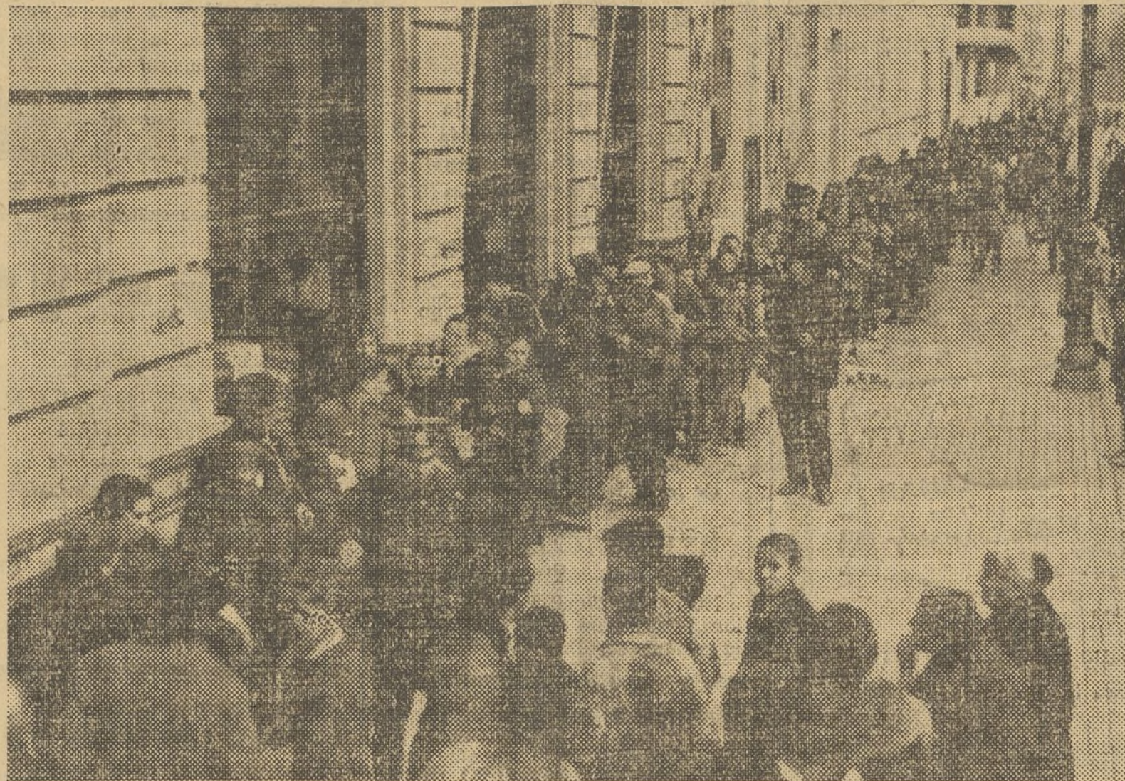
He aquí la cola interminable que hora tras hora estuvo desfilando durante todo el día de ayer, frente a los diversos puestos que la Junta del Ropero dispuso en los bajos de la Casa de la Democracia, para mejor poder cumplir así su obra benéfico-social

Este año, como en los anteriores, el Ropero Republicano Autonomista ha querido mitigar en estas fiestas de Navidad la angustiosa situación del menesteroso, acudiendo en su auxilio, prestándole su asistencia para que en lo íntimo de su hogar tuviese siquiera la alegría de poder celebrar fecha tan señalada por el mundo entero.