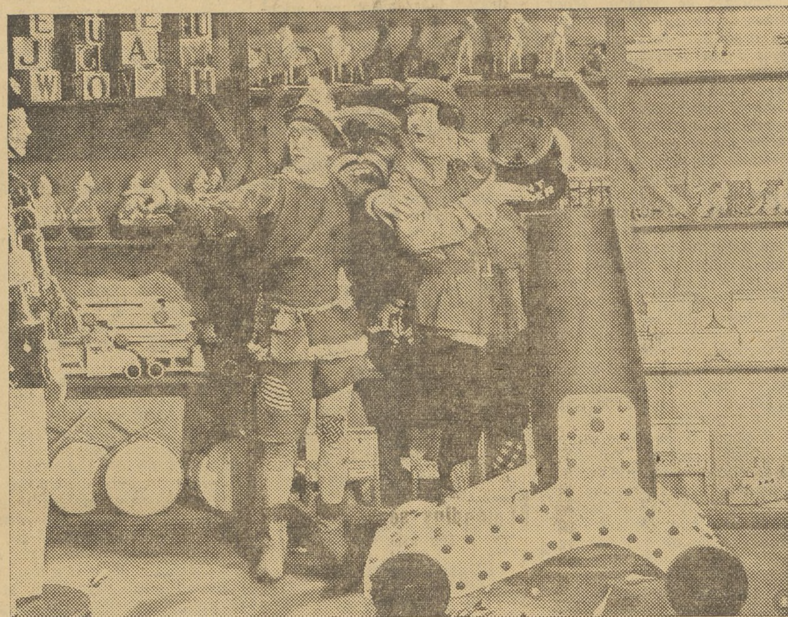
STAN LAUREL Y OLIVER HARDY EN SU FORMIDABLE CREACIÓN «HABÍA UNA VEZ DOS HERÓES», QUE MUY PRONTO PODRÁ ADMIRAR EL PÚBLICO DE VALENCIA

Realmente, la realización de «La verbena de la Paloma», que se ha estrenado en la pantalla del aristocrático Olympia, ya de por sí vale un elogio para la casa productora, que nosotros somos los primeros en dedicarle. Pero no bastan estas palabras. Necesitamos decir al mismo tiempo que el éxito es también debido a nuestro más joven, pero más concienzudo director, Benito Perojo — sin disputa ha realizado su más perfecta película — y al prestigio literario de Pedro de Répide. A éste se debe, principalmente, el éxito formidable del típiismo y el ambiente de este film verbenero. Y como ello trata del jolgorio po-