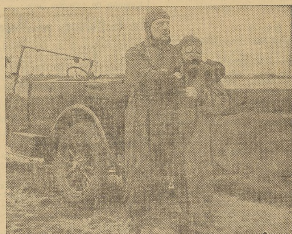
UNA ESCENA DE LA PRODUCCION POLACA «AMOR Y ESPIONAJE», QUE MUY EN BREVE PRESENTARÁ LA NOVEL ACTUARIAL VALENCIANA VARSOVIA FILMS

Las calles madrileñas, el clásico café, la botica, el sarao elegante-tecnicolor y los bulliciosos aspectos verbeneros, con todos sus detalles accesorios, son un verdadero ALARDE y un éxito de realización.—El ambiente de Madrid 1893, se ha logrado plenamente, y éste es uno de los más destacados méritos del film