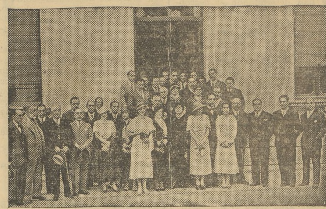
Autoridades, invitados y alto personal de la Unión Naval de Levante que han asistido al acto.

miento y les significó que si su próximo viaje a París no se lo impedía, les prometía venir a Valencia. Los obreros insistieron y le indicaron la fecha del 28 del actual.