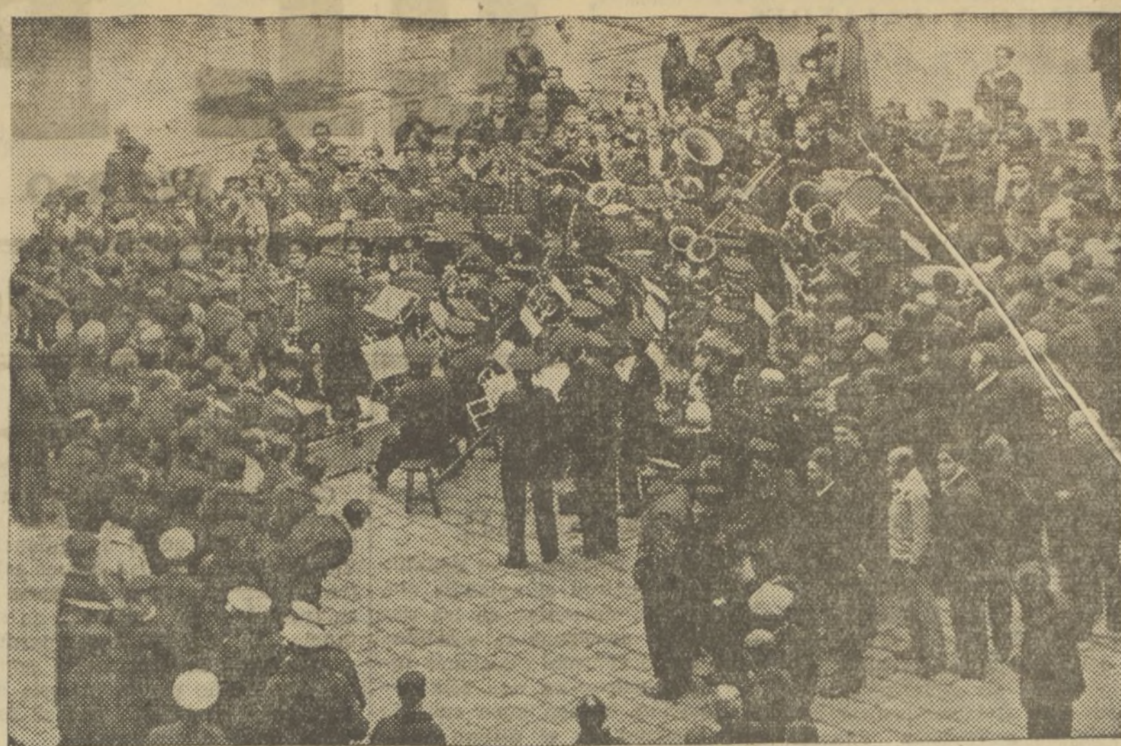
LA BANDA DE ALBORAYA INTERPRETANDO UN CONCIERTO EN EL PATIO DEL PENAL, A CUYO CONCIERTO PRESTAN SU CONCURSO TODOS LOS PENADOS

El acto, que se desenvolvió en un ambiente de respeto y hasta de fervor, dejó una profunda huella en el ánimo de los oyentes, ya que hasta en los aplausos tributados parecía que las alas de la fama y el fervor hacia el homenajeado los espantaban por aquellos ámbitos con cierta timidez en respeto y devoción.