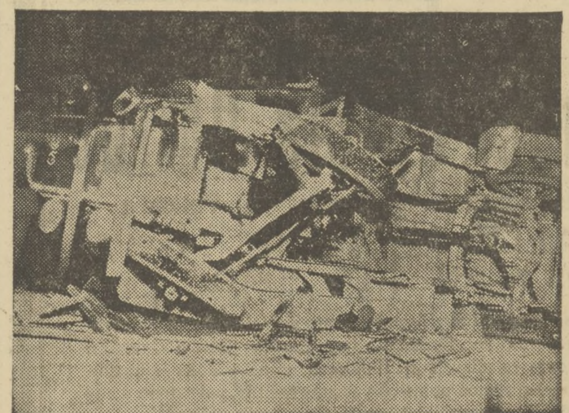
ASPECTO DEL CAMION CON EL QUE CHOCÓ EL AUTOBUS DE PASAJEROS, PRODUCIÉNDOSE LA CATASTROFE