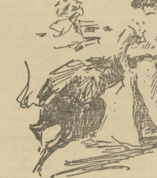
NINO DE LA ESTRELLA EN UN QUITE AL PRIMER NOVILLO