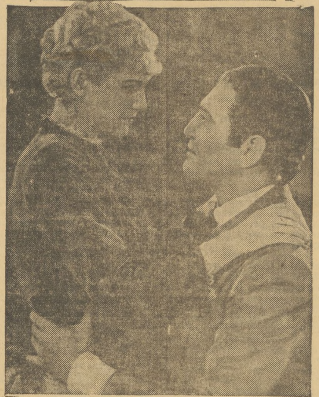
Richard Dix en una escena de la grandiosa producción Radio, «Los conquistadores»

La calidad de este film, reconocido como el mejor producido hasta hoy en Inglaterra, justifica los elogios que unánimemente le han tributado la Prensa y el público de la gran metrópoli norteamericana y explican la sensación que causó a París la presentación mun-