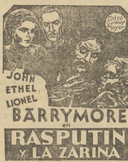
La más emocionante tragedia del siglo por los actores más famosos de nuestra generación