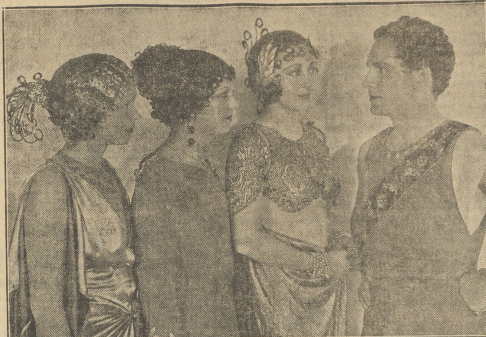
UNA ESCENA DE LA EXTRAORDINARIA SUPERPRODUCCION PARAMOUNT—CONSIDERADA LA PELICULA DEL SIGLO—«EL SIGNO DE LA CRUZ», QUE MANANA, EN FUNCION DE GALA, ESTRENA EL LIRICO