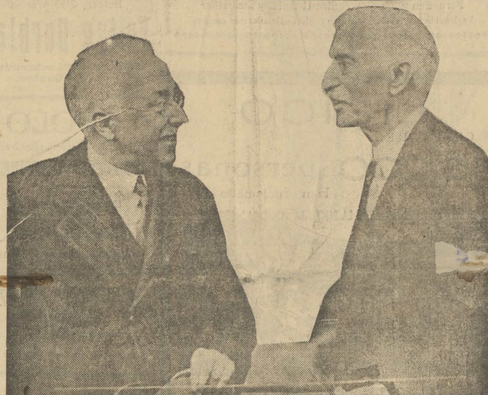
EN MAYO DE 1931. EL PRESIDENTE DE LA REPUBLICA, SALUDANDO AL SEÑOR MACIÁ A SU LLEGADA A BARCELONA