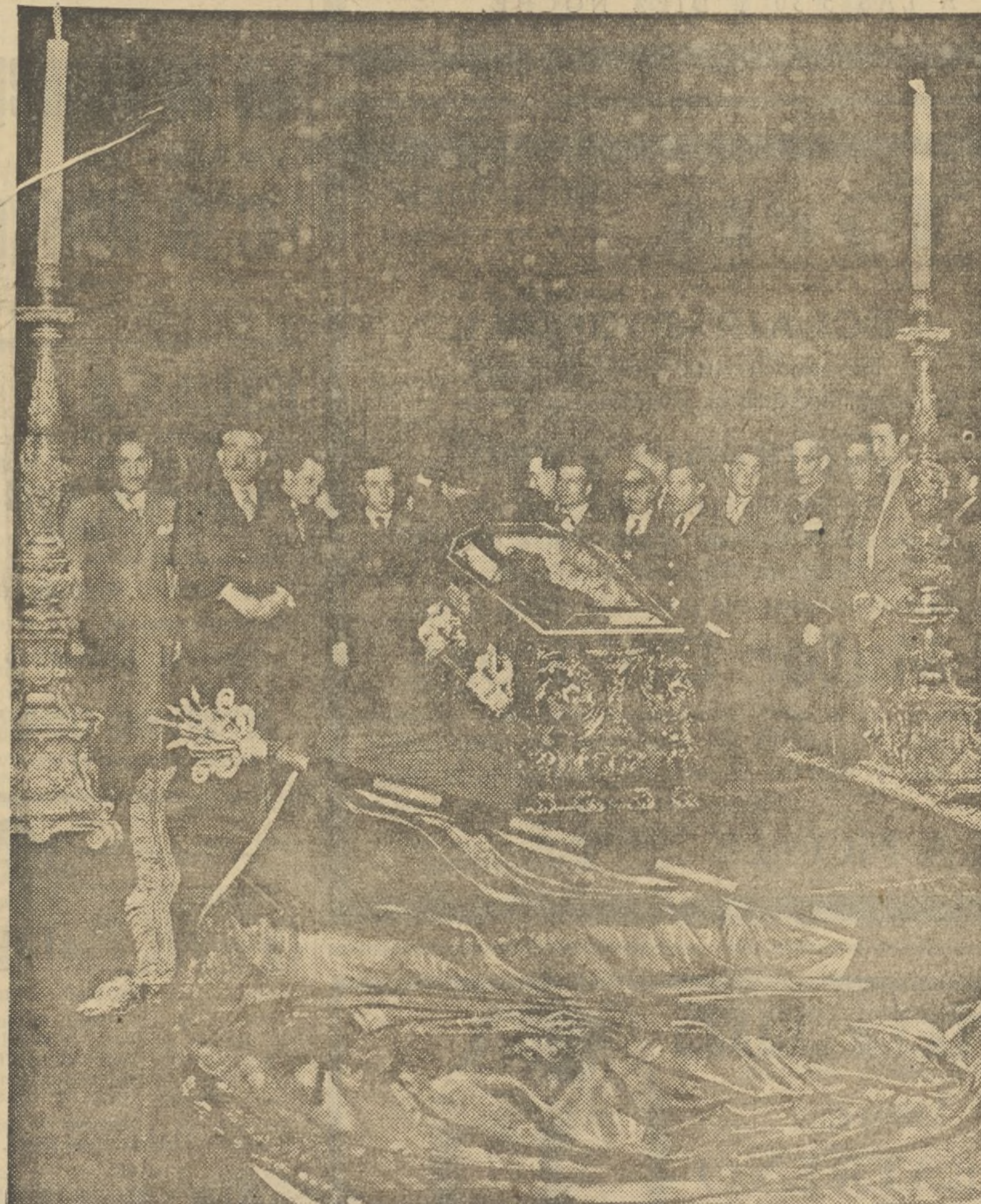
EL CAJÓN DE DON FRANCISCO MACIÁ, EXPUESTO EN EL SALON DE SAN JORGE DEL PALACIO DE LA GENERALIDAD