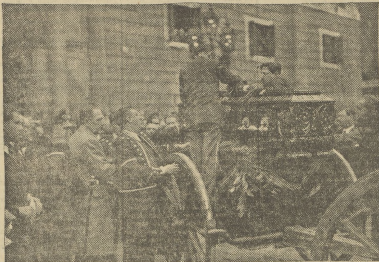
MOMENTO EN QUE ES DEPOSITADO EL FERETRO SOBRE EL ARMON DE ARTILLERIA A LAS PUERTAS DEL PALACIO DE LA GENERALIDAD

Barcelona ha quedado sin flores. Una oración sin precedentes, de devoción y tributo de homenaje inusitado y unánime a la figura cumbre del florido presidente.