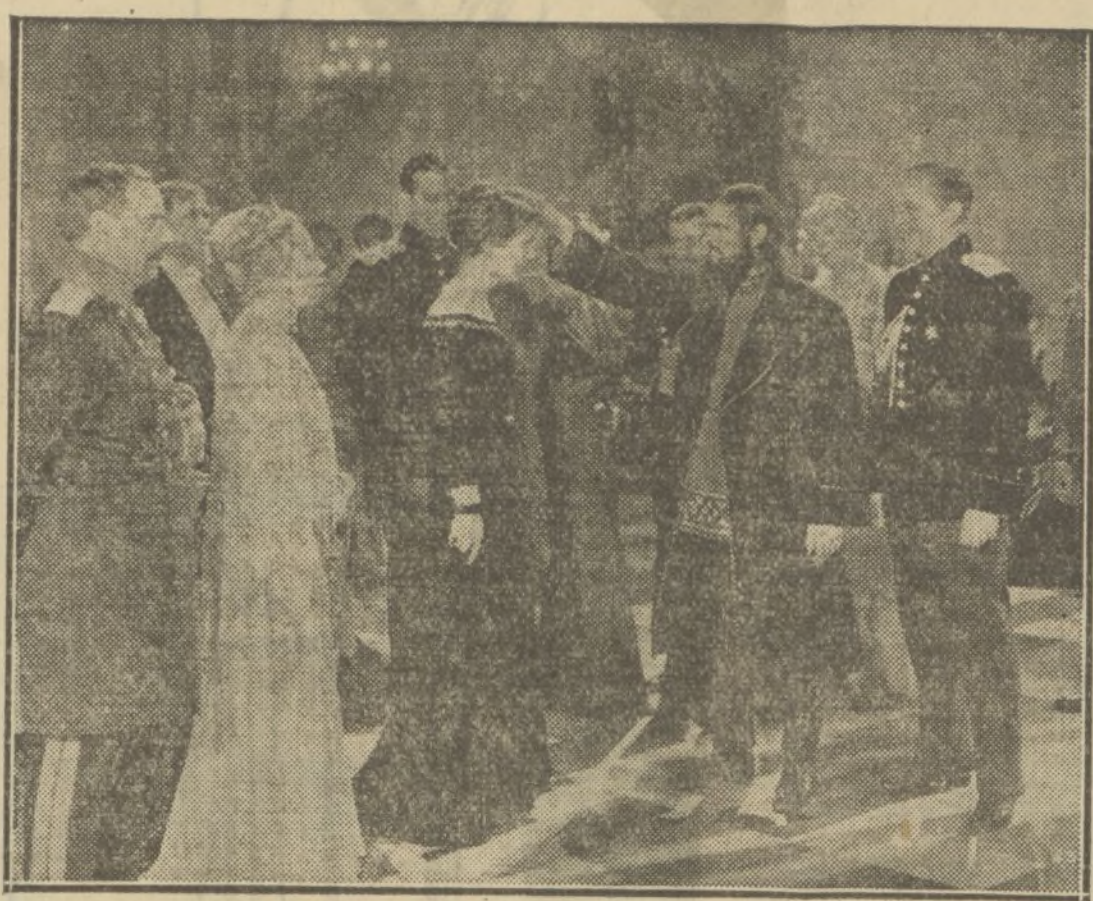
UNA ESCENA DE LA PELÍCULA «RASPUTIN Y LA ZARINA», QUE MUY EN BREVE ESTRENARÁ EL CAPITOL

También aportarán su directa colaboración el operador señor Gaortner, universalmente conocido, y el decorador Lippachitz, uno de los más grandes valores existentes en el mercado cinematográfico, todos ellos secundados por prestigiosos elementos, los cuales serán igualmente una garantía de que nada faltará a esta