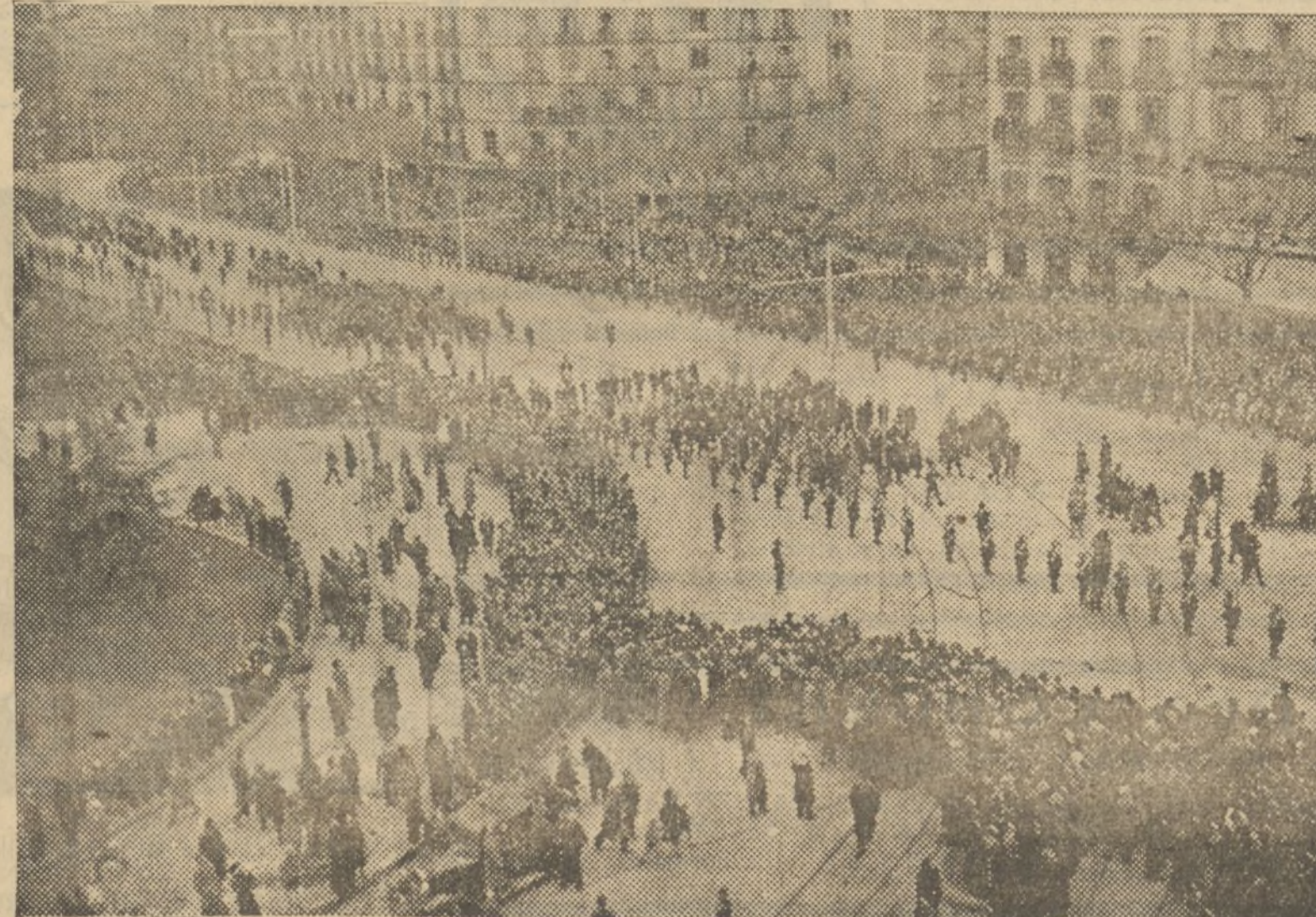
DESFILÉ DE LA COMITIVA POR LA PLAZA DE CATALUÑA