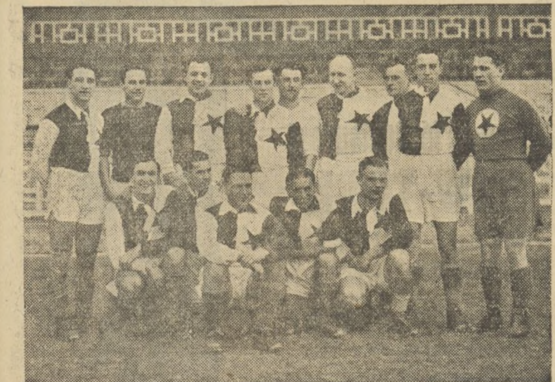
EL EQUIPO DEL SLAVIA, QUE LUCHARA CONTRA LA SELECCION REGIONAL

Ante el formidable partido de mañana entre el Slavia y una selección valenciana