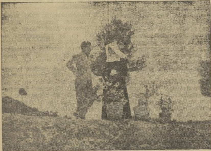
Un precioso exterior de la película «La hermana San Sulpicio», que la Cifesa está filmando para la próxima temporada

Mientras que, actualmente, el resto de las acturias de España andan atareadas con la confección de su programa, de una lista de material para la próxima temporada 1934-35, nuestra