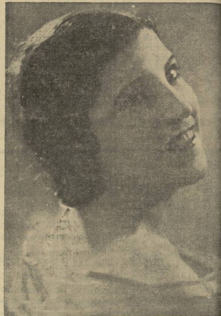
Licia Albanese, juventud y arte. Esta artista ha triunfado completamente en los grandes teatros de Italia, llegando a conquistar un suceso su interpretación de «Madame Butterfly». En los Viveros cantará «Il Pagliaccio»

Este año, como los anteriores, presentan los periodistas una programación que, puesta por una prensa, tendría que pagarse con