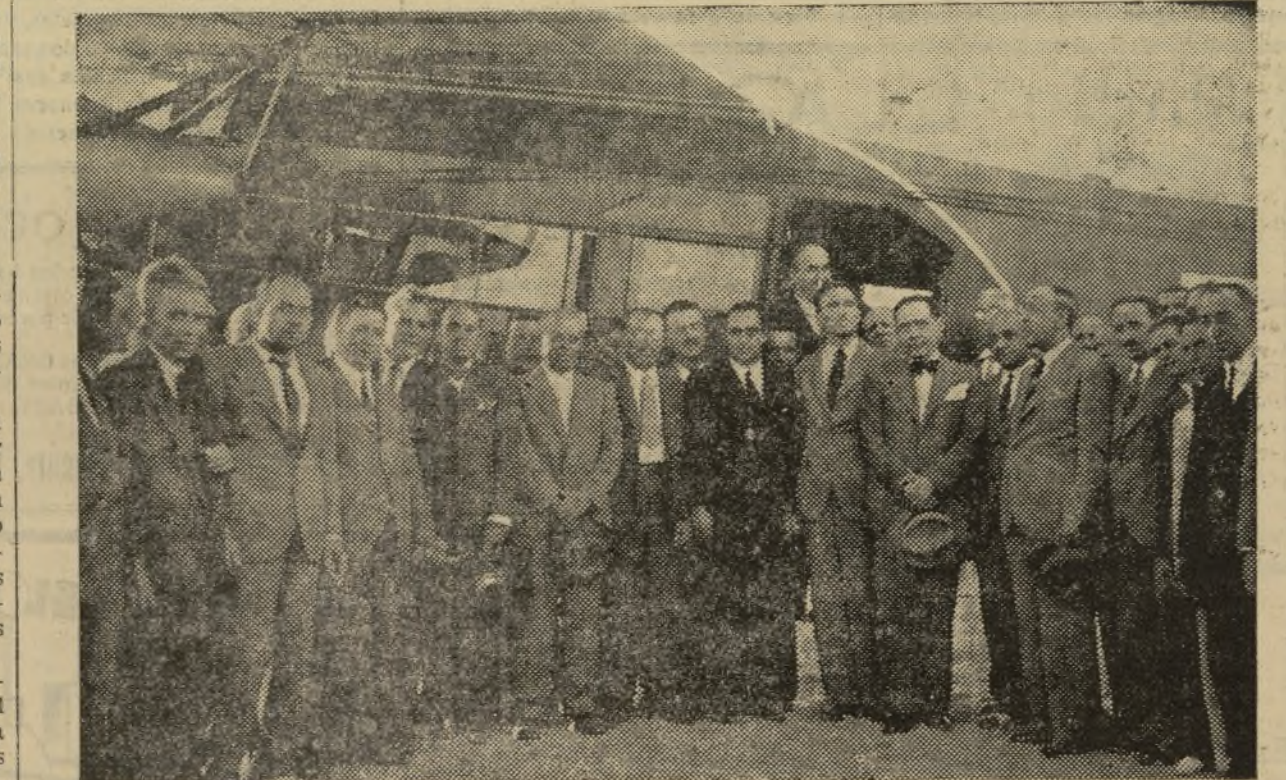
LOS PASAJEROS Y AUTORIDADES, MOMENTOS DESPUES DEL ATERRIZAJE

Es constante porque lleva a bordo un radiotelegrafista.